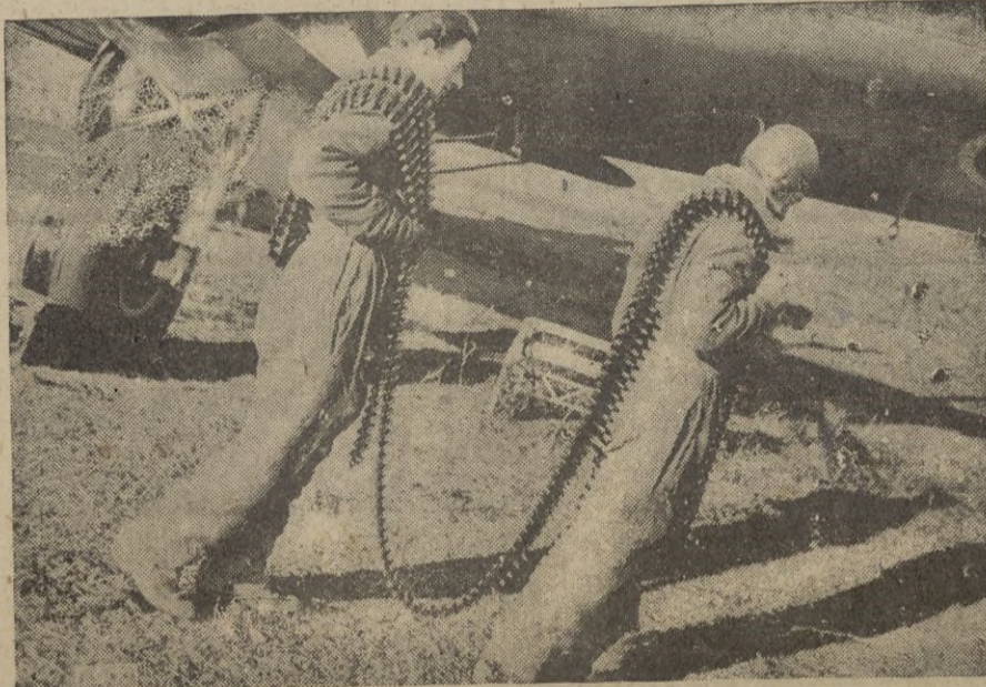
En una base aérea de Albania. Antes de la acción cargando a bordo las cintas de los proyectiles para la ametralladora.

de esto; pero creo que la situación no sigue un mal camino. — EFE.