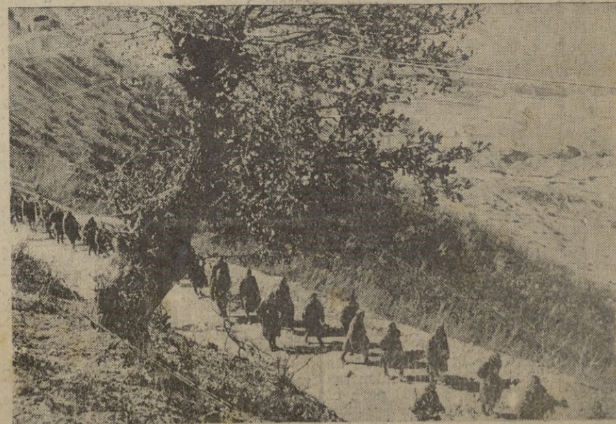
Frente griego-albanés. Una columna de prisioneros griegos, en marcha en la retaguardia italiana.

En Africa oriental sin novedades de importancia que mencionar. — EFE.