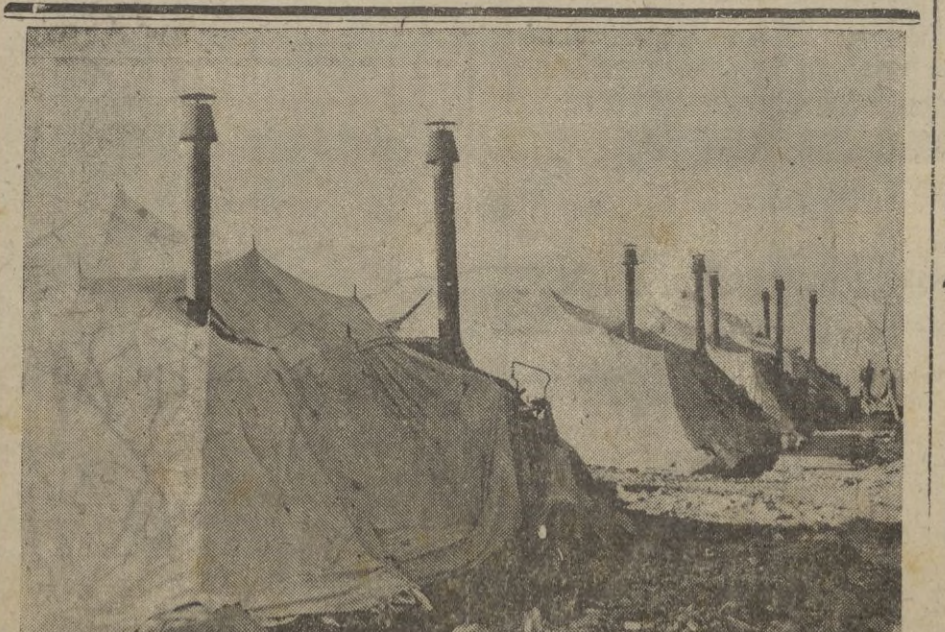
Servicio de subsistencia para las tropas italianas en el frente griego-almán. Los hornos de calor.

Abisinia. — Continúa nuestra persecución del enemigo vencido y des-