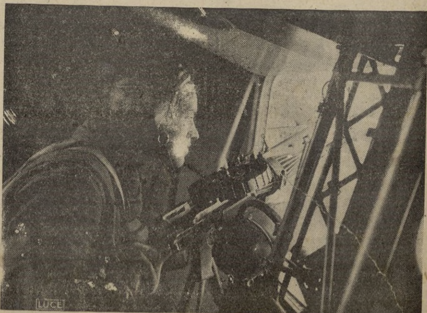
Sirviente de ametralladora italiano dispuesto para una acción durante un vuelo en territorio griego.

Los vencedores de ida se jugarán el día 20 en los campos de los clubs citados en primer término y los de vuelta el día 27, en campo contrario. —CIFRA.