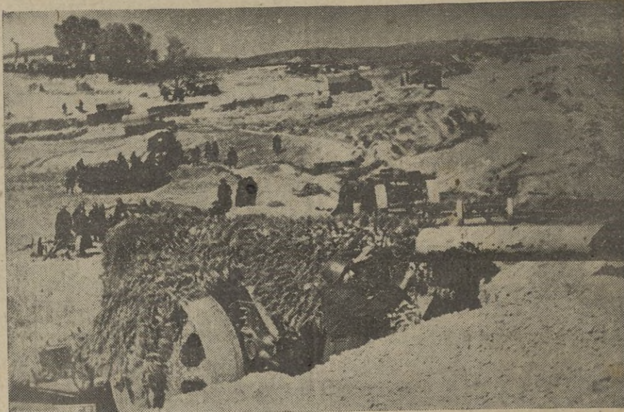
Frente griego-albanés. - Un cañón italiano de calibre medio, convenientemente oculto.

De momento no se sabe el motivo de esta visita con certeza, pero parece ser que se trata de conseguir la suspensión de las hostilidades. — EFE.