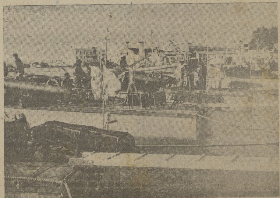
Lanchas rápidas italianas ancladas en una base naval.