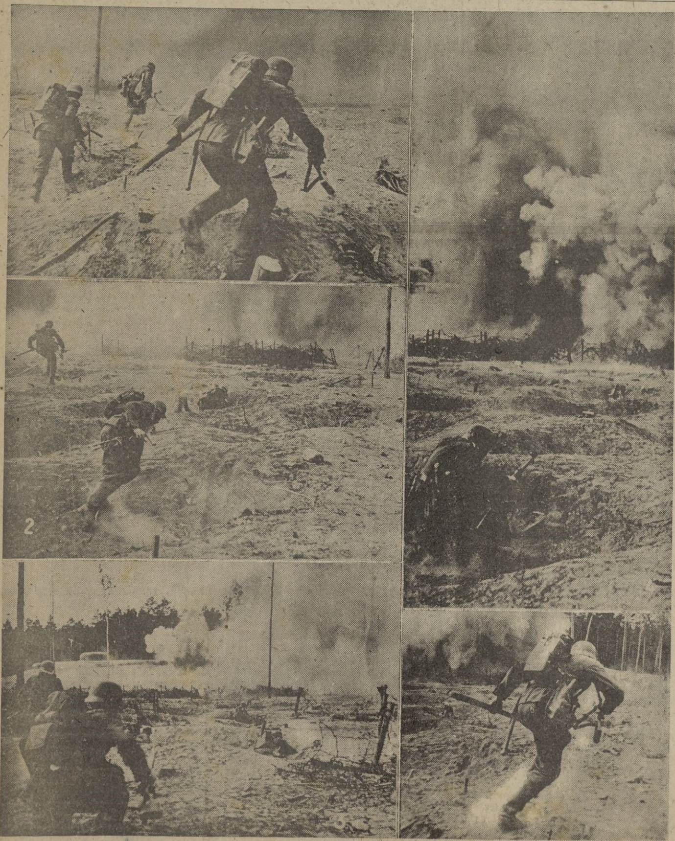
1.--Momentos iniciales del combate, cuando los soldados saltan de sus trincheras hacia el enemigo. -- 2.--Las tropas de choque avanzan protegidas por el fuego de las armas de retaguardia. -- 3.--Poco a poco, pero con seguridad, se aproximan al objetivo. -- 4.--Pistola ametralladora en la derecha y bombas de mano preparadas, se dispone para la última fase del asalto. -- 5.--La orden definitiva ha sido dada por el mando.

Londres, 16. -- La Agencia Reuter comunica que las últimas noticias llegadas a Londres sobre la situación militar en Yugoslavia indican que el estado de cosas se agrava notablemente. Parece que la resistencia que se opone ha experimentado un serio cambio, y que se adopta la forma de guerrillas, en escala cada vez más importante. -- EFE.