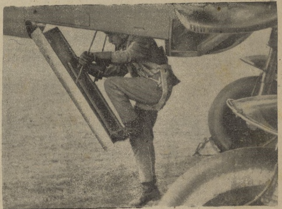
El piloto subiendo al aparato, listo para emprender el vuelo.

Reuter comunica que fueron derribados durante la pasada noche, seis aviones alemanes. — EFE.