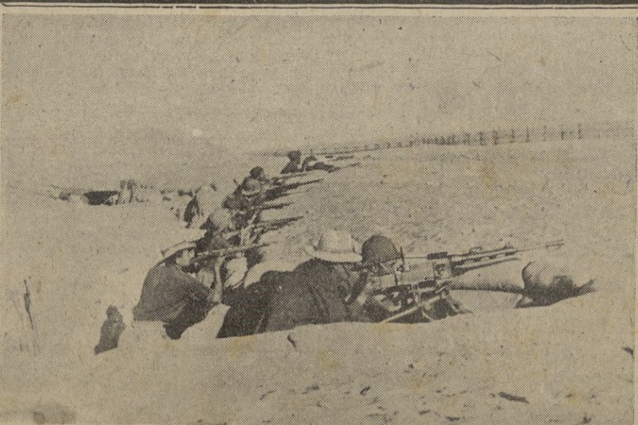
Frente de Africa Septentrional. -- Una trinchera italiana de primera línea en la organización defensiva de la región Sirtica.

Estambul, 19. -- A consecuencia de las inundaciones, ciento cincuenta granjas se han derrumbado cerca de Suirna. Las cosechas han quedado deshechas. -- EFE.