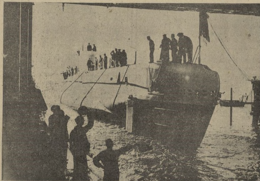
El submarino inglés "Snapper" hundido por los alemanes