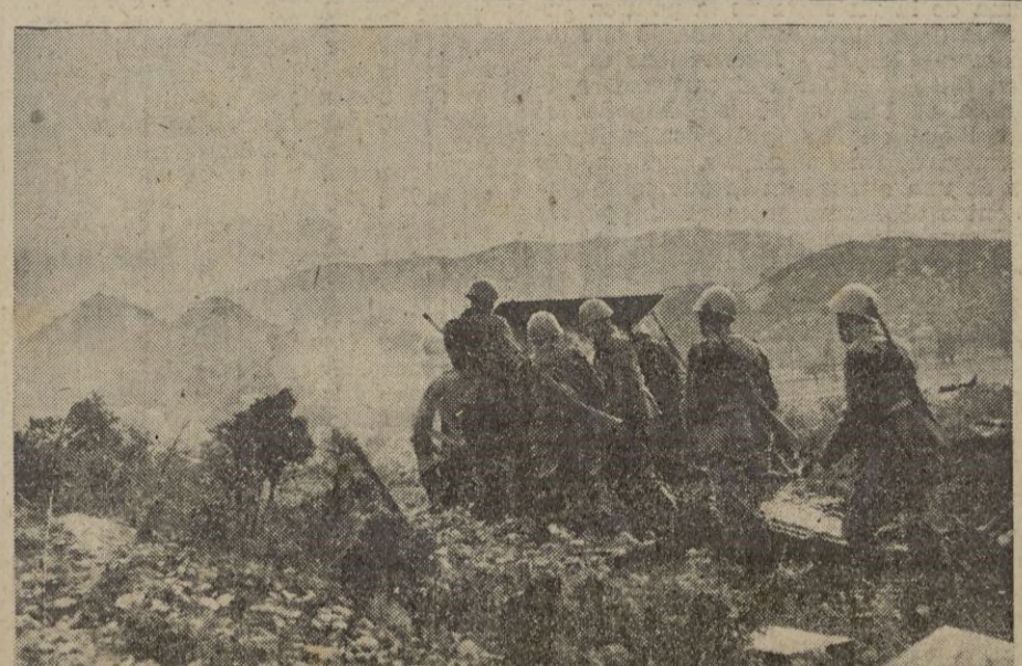
Tropas italianas en el frente griego-albanés. Una batería en acción contra las líneas enemigas.

380 plazas Especialistas. Viaje cuenta Estado. Exámenes en Málaga. Edad de 18 a 23 años. Se admiten individuos que presten sus deberes militares en la actualidad. Tramitación documentos, informes e instancias en AGENCIA RAMOS, Cervantes 17 (junto al Instituto).