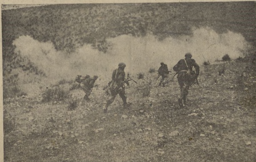
Tropas italianas avanzando en el frente griego-albanés.

Interrogado acerca de los rumores de retirada de tropas rusas en Extremo Oriente, respondió: "Isa pregunta debe dirigirse a Stalin y Molotov, y no a mí". — EFE.