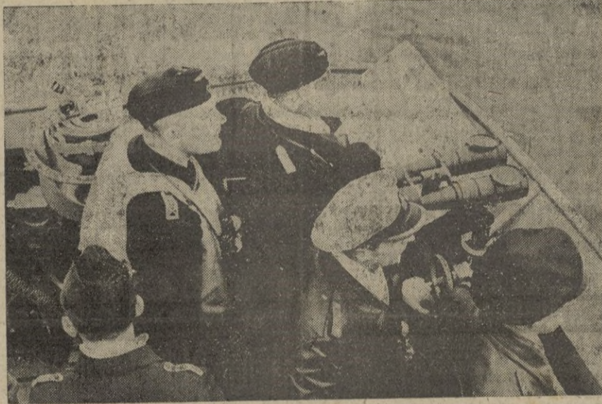
Torpederos alemanes asegurando a los convoyes.