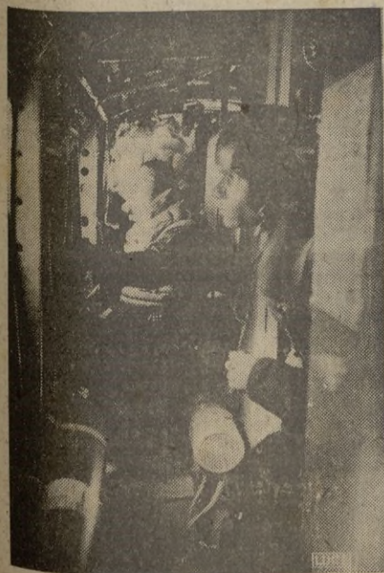
Interior de un aparato de bombardeo italiano durante un vuelo de guerra. Cada uno está listo en su puesto contra toda agresión de la caza adversaria.

Personas de la intimidad del Presidente declaran a su vez que los Estados Unidos actuarán de modo muy eficaz, pues así lo exige la situación actual. — EFE.