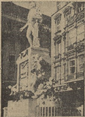
Estatua de Mozart en Viena