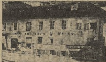
La casa de Mozart en Salzburgo.

"Y era tan hermosa la vida", añadía, en cuyas palabras se refleja toda la grandeza, toda la idealidad de este preclaro genio, el verdadero creador de la ópera alemana, que en absurdo contraste con esa vida íntima, excepcional, tuvo que vivir la material de un modo verdaderamente miserable, lleno de angustias y privaciones, como nos lo confirma otra emocionante carta, admirada junto a la anterior y cuyos rasgos no olvidaremos nunca, para otro amigo suyo en un día en que hasta carecía del más modesto alimento: "...he venido a comer a vuestra casa, sin haber sido invitado... he llegado a encontrarme desprovisto de todo medio, rogándoos vuestra ayuda