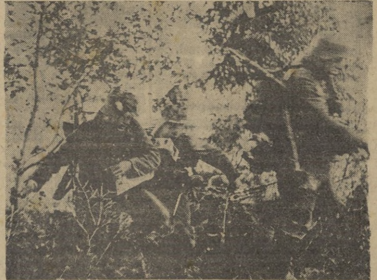
Por este terreno abrupto tiene que realizar sus movimientos la Infantería germana.