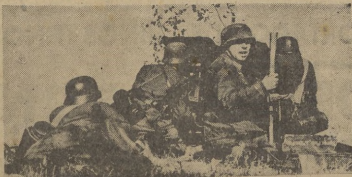
Infantería y Artillería alemana en puesto de observación.

El ingreso que su venta proporcione, ha comunicado su autor que lo destinará a la División Azul. — CIFRA.