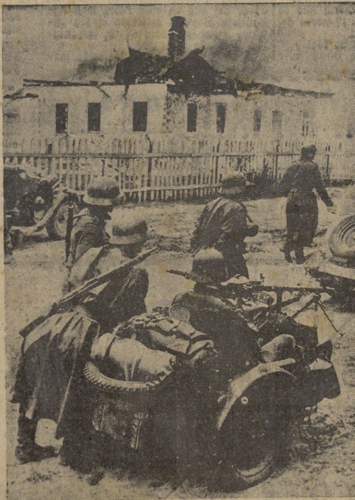
FRENTE ORIENTAL. — Una columna motorizada alemana, hace su entrada en una aldea bolchevique, que ha sido sometida por los rojos, en su huida, al martirio del fuego

En Malasia prosigue el avance hacia Singapur. — EFE.