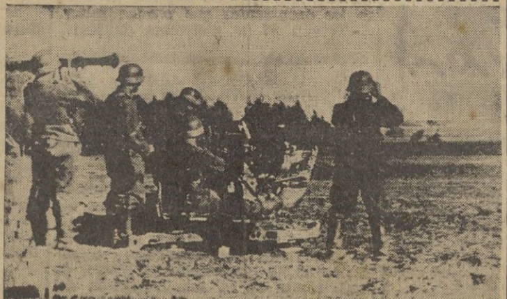
ANTIAEROS CONTRA TANQUES.—El jefe y el telemetrista de esta batería antiaérea alemana observan los movimientos de una formación de tanques soviéticos, para entrar en acción en el momento preciso

Administración Central.— Gobernación.— Dirección General de Arquitectura.— Citando a los propietarios de las fincas afectadas por el proyecto de construcción de grupos de viviendas económicas en el término de Chamartín de la Rosa, sector de Valdeacedera para que se personen por sí, o por representante lega, el día once de enero de 1942, en dichos terrenos para asistir al levantamiento y venta de ocupación. — CIFRA.