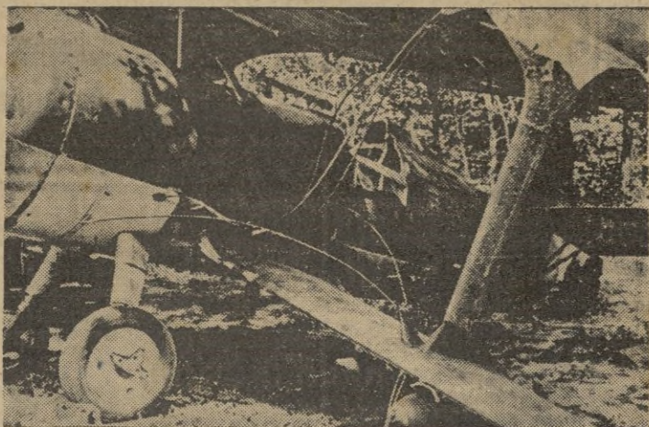
DOCUMENTAL DE GUERRA.—En un ataque de los aviones de combate alemanes fueron destruidos numerosos aviones rusos en tierra. La foto muestra uno de ellos

En Africa del Norte se atacaron con éxito los objetivos británicos de Derna y Tobruk. — EFE.