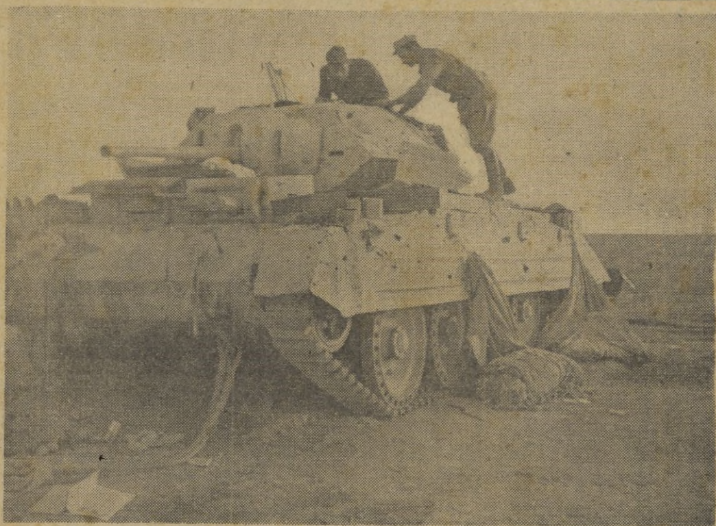
Tanques ingleses cogidos por las tropas italianas en los recientes combates del frente de Aguedabia

Lima, 30. — El diario "La Prensa" hace un elogio de la Exposición del Libro Español, inaugurada solemnemente por el embajador de España y po-