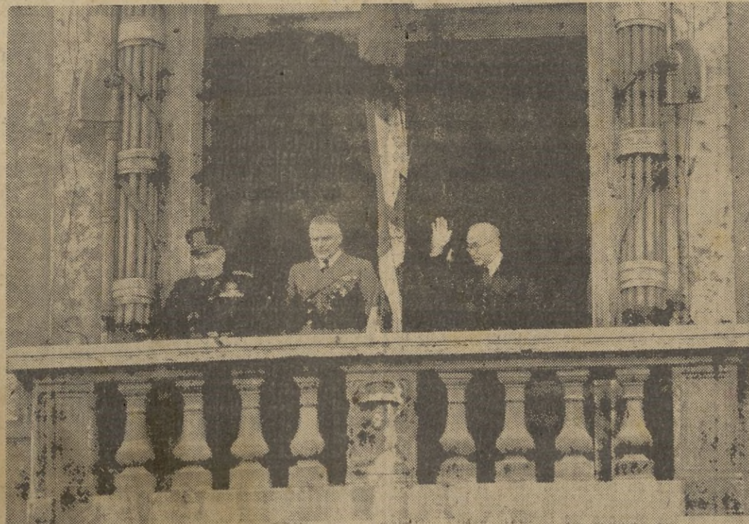
El Duce con los Representantes de Alemania y del Japón mientras responde a las aclamaciones de la muchedumbre reunida en la Plaza de Venecia, el día de la declaración de guerra de las potencias del Eje a los Estados Unidos.

sesiones del VI Consejo Nacional de la Sección Femenina de F. E. T. y de las J. O. N. S.