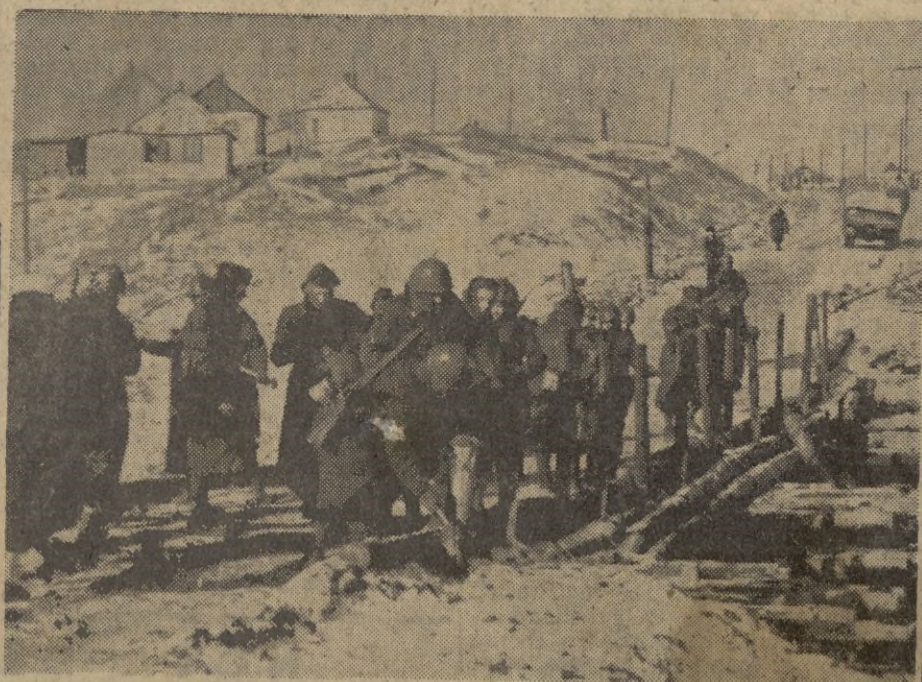
Soldados italianos en la región del Donetz, construyendo con medios improvisados un puente para facilitar el paso de fuerzas motorizadas

doba, Catedral de Cuenca, Monasterio del Párral de Segovia y otros Intitutos de primera enseñanza. — CIFRA.