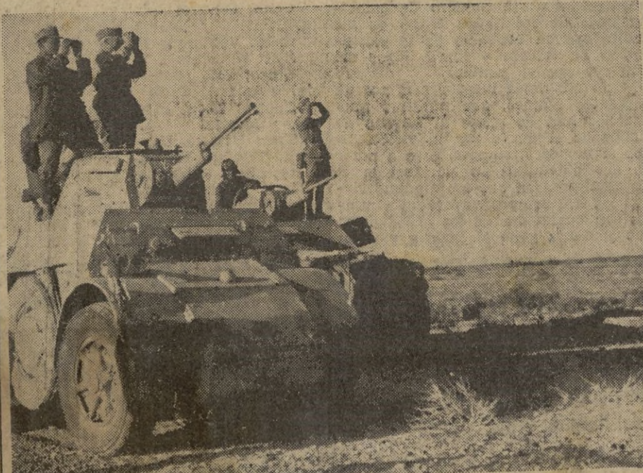
FRENTE AFRICANO. -- El Estado Mayor italiano de una división blindada sigue el curso de una batalla que se desarrolla al Sur de Bengasi.

Nuestros cazas han derribado en combate aéreo cinco aparatos enemigos. Además, un avión adversario fué destruido en tierra. -- EFE.