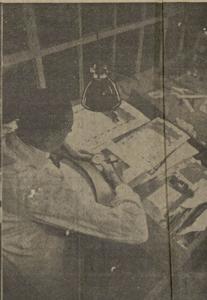
Litografía. -- Buen alumbrado

de Trabajo, volvía de nuevo a recordar en Notas insertadas en la Prensa y en el Boletín de la Ciudad, la obligación que tienen todas las Empresas de cumplimentar el contenido de dichos Reglamentos, muy especialmente en lo que a iluminación se refiere.