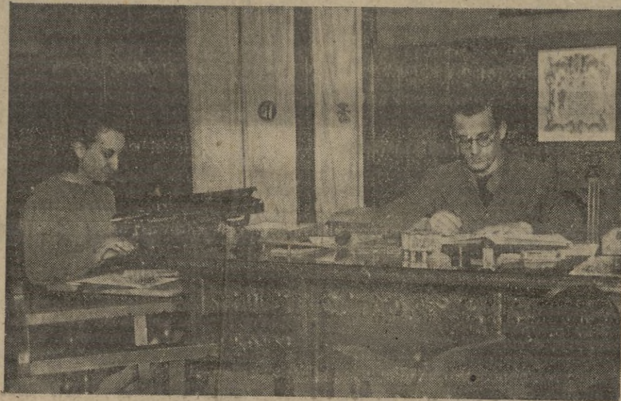
El Delegado de Auxilio Social y su Secretaria en plena actividad.

Esta es en líneas generales la gestión de "Auxilio Social" en el año que finaliza, labor que sólo con su lectura no necesita los elogios a que son merecedoras, las Jerarquías y camaradas (tanto femeninas, como masculinas) que con todo cariño, y entusiasmo prestan servicios en dicha Obra.