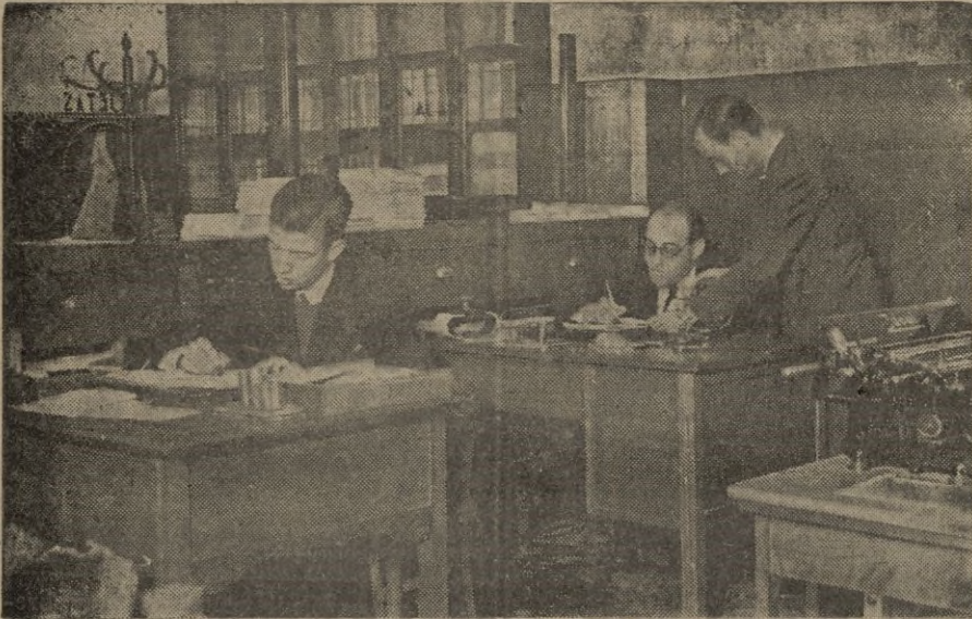
Personal de la Cámara de la Propiedad que tan acertadamente han actuado.

Hermosa obra realizada por la Cámara de la Propiedad Urbana de Ceuta en cumplimiento de un decreto del Caudillo