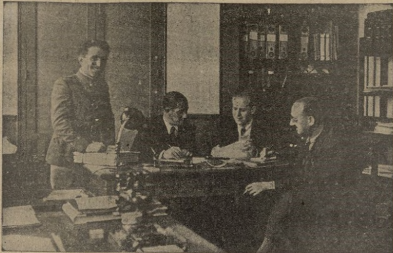
Los jefes del Servicio explican a nuestro director el interesante movimiento del año 1940

Una de las entidades que durante el pasado ejercicio han tenido que desarrollar un trabajo abrumador, ha sido la correspondiente a Subsidio al Combatiente.