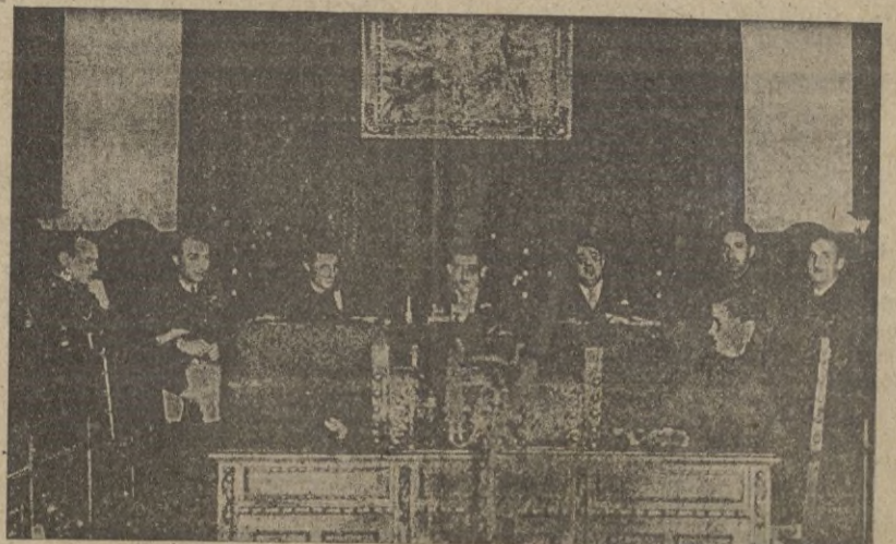
La Comisión Permanente celebra su acostumbrada sesión semanal.

Muchos e interesantes son los trabajos que están estudiándose por los arquitectos municipales, pero hasta que su realización vaya a ser puesta en marcha, preferimos no dar detalles a nuestros lectores.