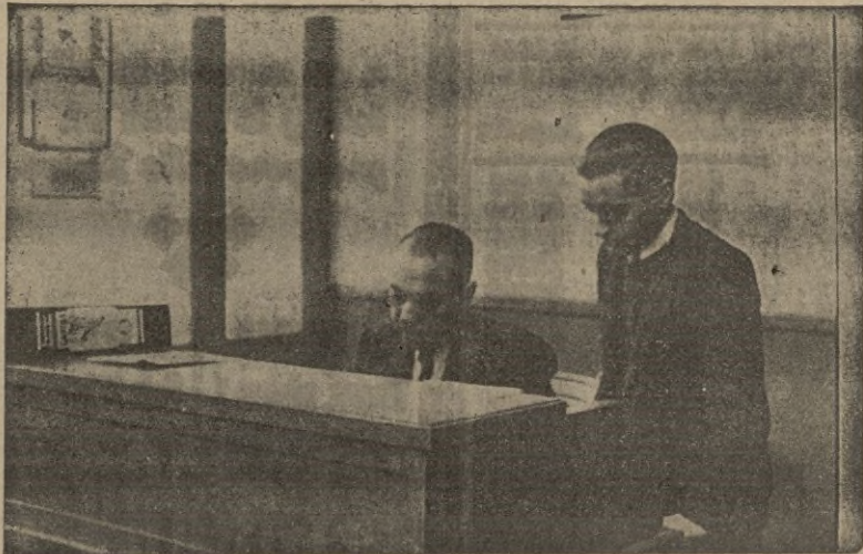
El Jefe del Servicio despachando con su secretario

Por Plato Unico 431.633'19 ptas. Participación en multas 5.352'30 pesetas. Intereses devengados en Bancos 101'55 ptas. Participación en venta de papel