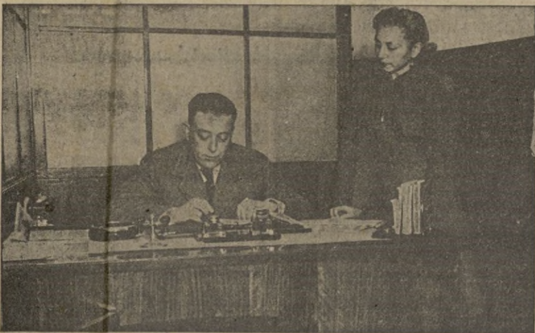
El Delegado Provincial del Instituto Nacional de Previsión, despacha con su secretaria.

Trabajo imponderable ha sido el desarrollado por el personal adscrito a esta entidad, durante el pasado año de 1940.