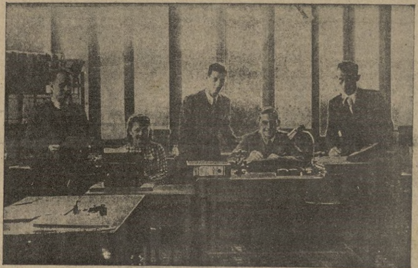
Personal afecto a este servicio