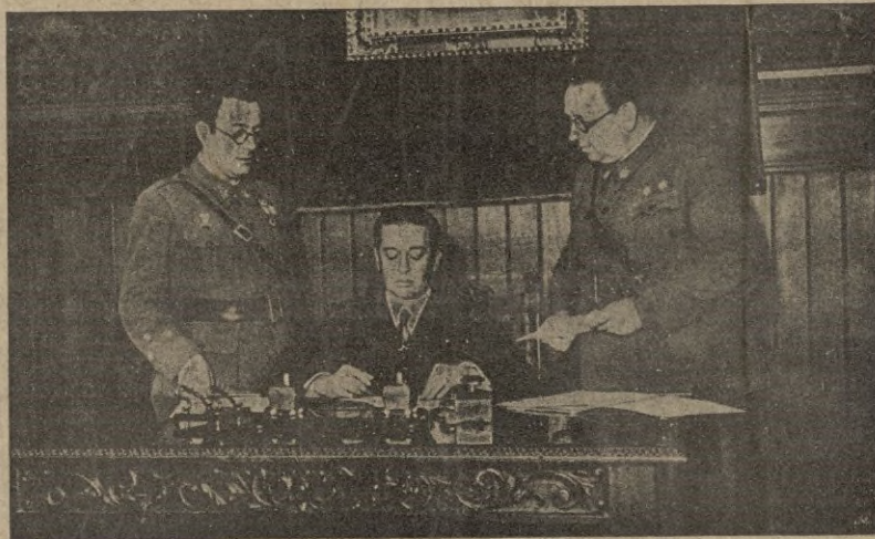
El Presidente de la Comisión Provincial-Comarcal vocal y secretario, despachando asuntos del servicio.

Ceuta, a la que personalmente y por escrito ha honrado y distinguido con su felicitación repetidas veces.