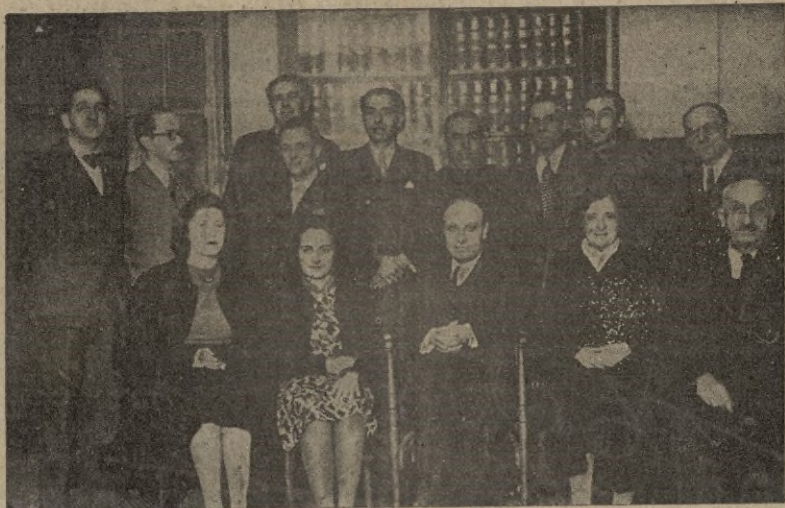
Claustro del Instituto Hispano Marroquí

Estoy seguro, —termina diciéndonos— de la colaboración entusiasta y