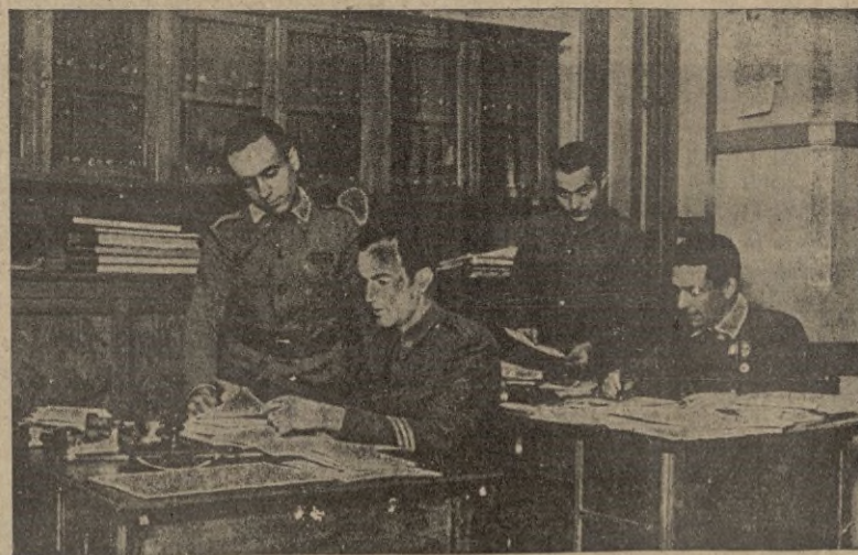
Personal subalterno del Benemérito Cuerpo de Mutilados.

Bajo el amparo de la Comisión de Ceuta, se encuentran, además de los mutilados en la guerra de liberación, que residen en Ceuta y en la Zona Occidental de Marruecos, 109 oficiales, suboficiales, clases y soldados, procedentes del antiguo Cuerpo de Invalidos.