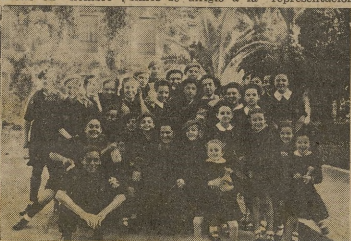
A la salida de la Residencia nuestro objetivo fotográfico capta al grupo de pequeños y pequeñas en cuyos rostros se les nota la satisfacción que les embarga

chas, Flechas Azules y Margaritas, a fin de felicitar al Excmo. señor General Asensio y su ilustre esposa, con motivo de la entrada del año nuevo.