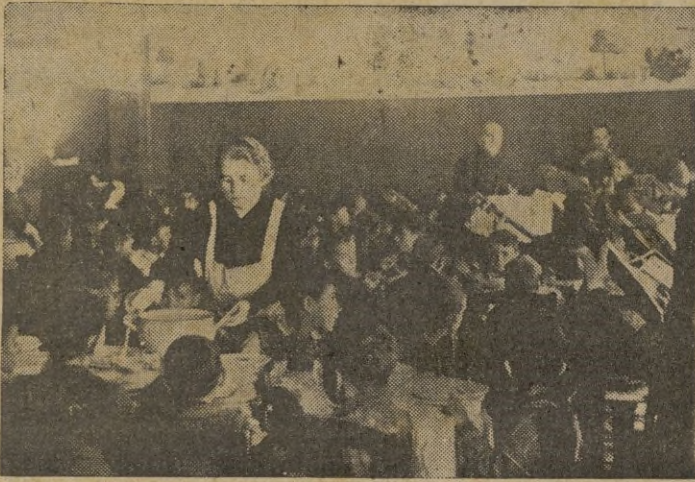
En los Comedores de Auxilio Social. - Detalle del salón infantil durante la comida con que fueron obsequiados los pequeños y ancianos en la mañana de ayer

La ilustre dama, le contestó emocionada, dándole las gracias, que rogaba transmitiera a las demás pequeñas de la sección femenina del Fren-