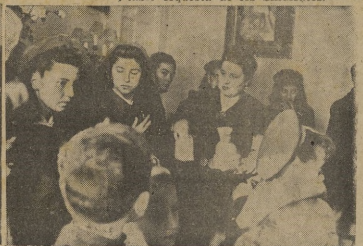
La Excm. Sra. de Asensio obsequia con bolsas de bombones a los pequeños visitantes.