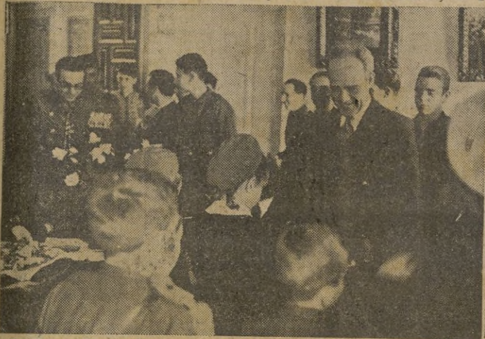
S. E. el General Asensio, complacido de la gentil visita, los obsequia mientras habla con cada uno de ellos entre el natural entusiasmo de los pequeños.

A la una se celebró la comida en los centros y comedores de Auxilio Social, asistiendo las autoridades de la plaza y jerarquías del Movimiento. El acto fué amenizado por la notable orquesta de los Sindicatos.