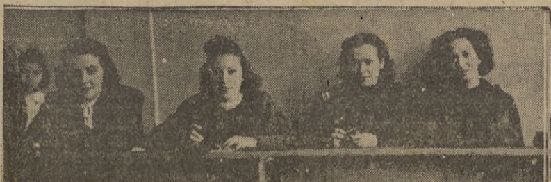
Señoritas que tuvieron a su cargo el canje de cupones.