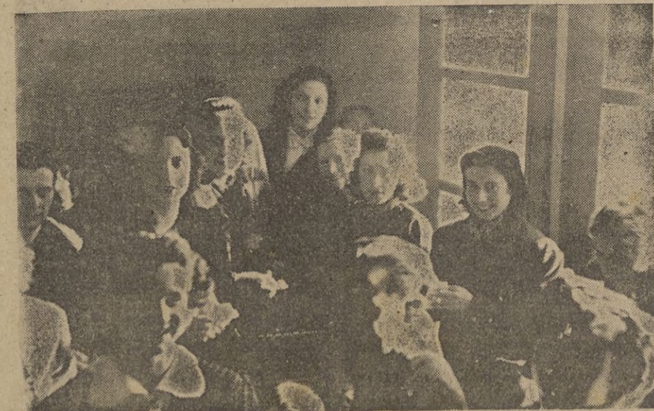
Preciosas chiquillas, espléndido ramo de lindas gardenias, que ayudaron nuestra labor preparando las papeletas que habían de servir para el sorteo.

El referirnos a ellas individualmente sería labor larga y difícil. Entre las auxiliares honorarias, las había rubias y morenas. Pero a fuer de sinceros hemos de decir, que si a propósito se hubiesen elegido, no habrían podido encontrarse ni más simpáticas ni más bonitas. Orgullosos nos hallamos de nuestra suerte, y al dar gracias al ramillete de rosas de pitimín que con nosotros colaboraron, les suplicamos nos perdonen si de nuestra pluma no sale el inspirado madrigal que merecen, pero, ciertamente, las emociones del día nos han dejado un tanto fatigados, y la fluidez de que tantas veces hicimos gala, hoy nos falla, y solo sabemos decirles ¡Gracias, preciosas!