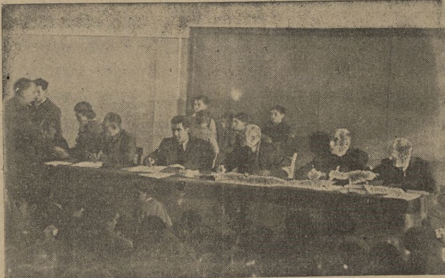
Presidencia del acto.