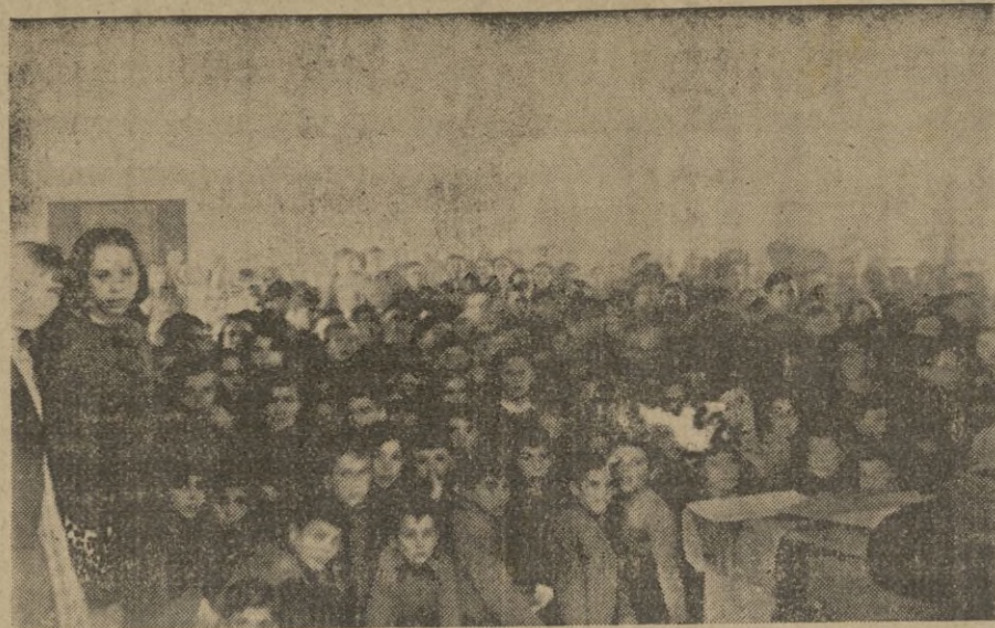
Aspecto soberbio de medio salón. Los chiquillos en magnífico hacinamiento, esperan con ansia el número que cumpla el objetivo de sus esperanzas e ilusiones.