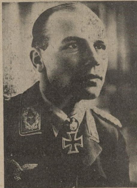
El comandante Wick, jefe de la célebre escuadrilla de caza "Richthofen", no regresó a su base del vuelo, en que logró su 56 victoria en combate aéreo.

Las salas del Gran Hotel se hallan ocupadas por filas de colchones los que los vecinos pudieron salvar del siniestro y los que han sido prestados a los que no pudieron hacer lo mismo. Los muebles que se consiguió traer a las llamas están todos ellos dispuestos en filas con el mayor orden. Estos aliados, como por el momento nada tienen que hacer en la ciudad, permanecen constantemente en sus respectivos hoteles y de esta manera se consigue evitar el entorpe-