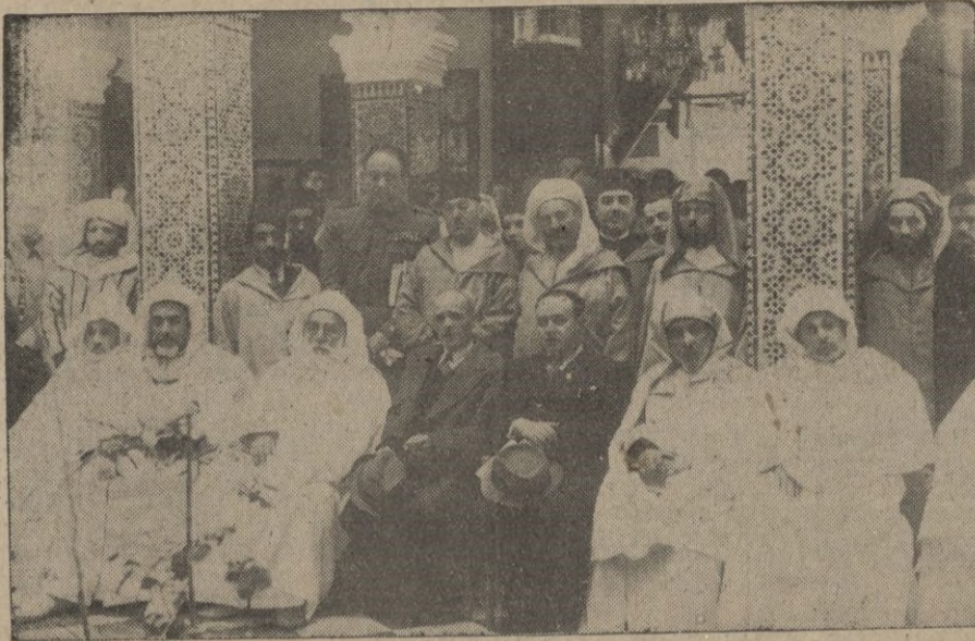
Un momento del te con que fué obsequiado el Excmo. señor Secretario General de la Alta Comisaría con motivo del honor de haberle sido recientemente concedido el premio FRANCO, cuya información publicamos ayer