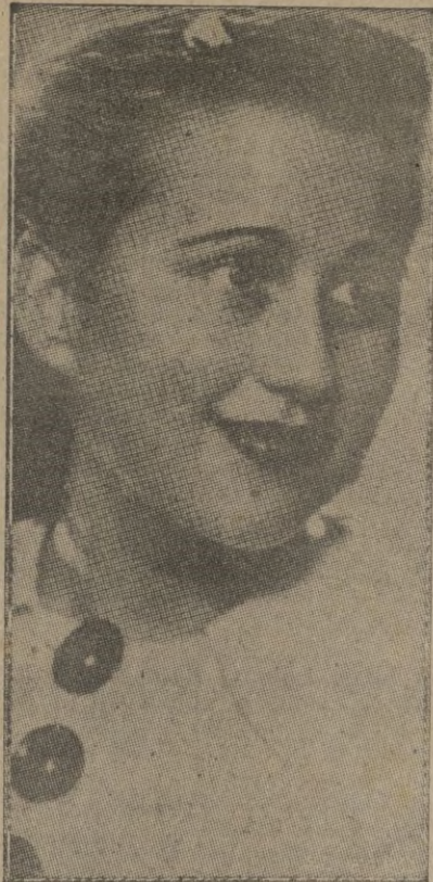
ADELITA VIANOR Primera figura femenina de los Espectáculos Vianor