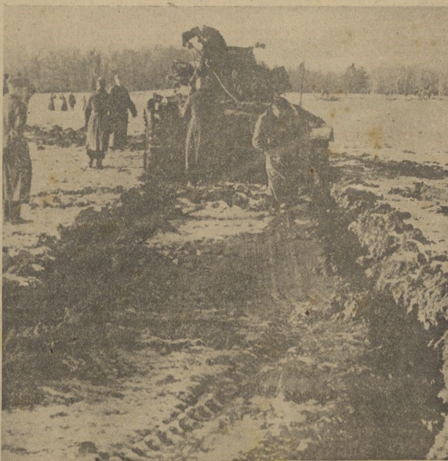
Los tanques pesados alemanes dejan grandes huellas de su paso, pero a pesar de todo avanzan.