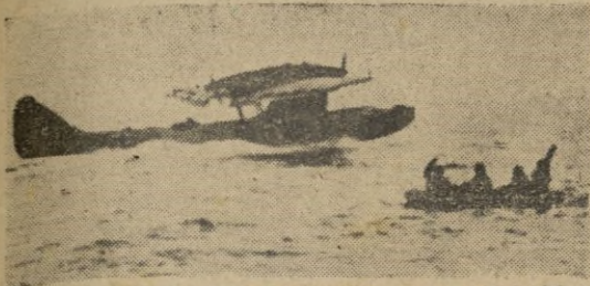
Cuatro aviadores naufragos son recogidos en alta mar por un avión de socorro alemán