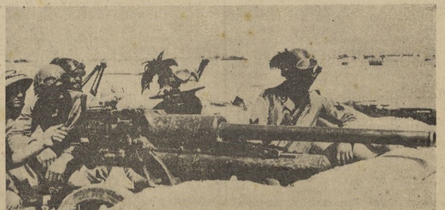
Cañones antitanques y antiaéreos italianos en territorio egipcio, pasado Sollu m.