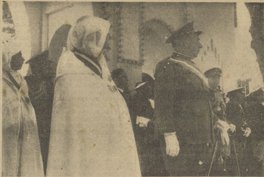
S. E. el Teniente General Orgaz acompañado del Excmo. señor Gran Visir y altas autoridades españolas y musulmanas presencia el paso de la manifestación ante la puerta de la Residencia.

Terminada la manifestación S. E. el Teniente General Orgaz, pasó al salón del Trono de la Alta Comisaría donde acompañado de los Excmos. Se