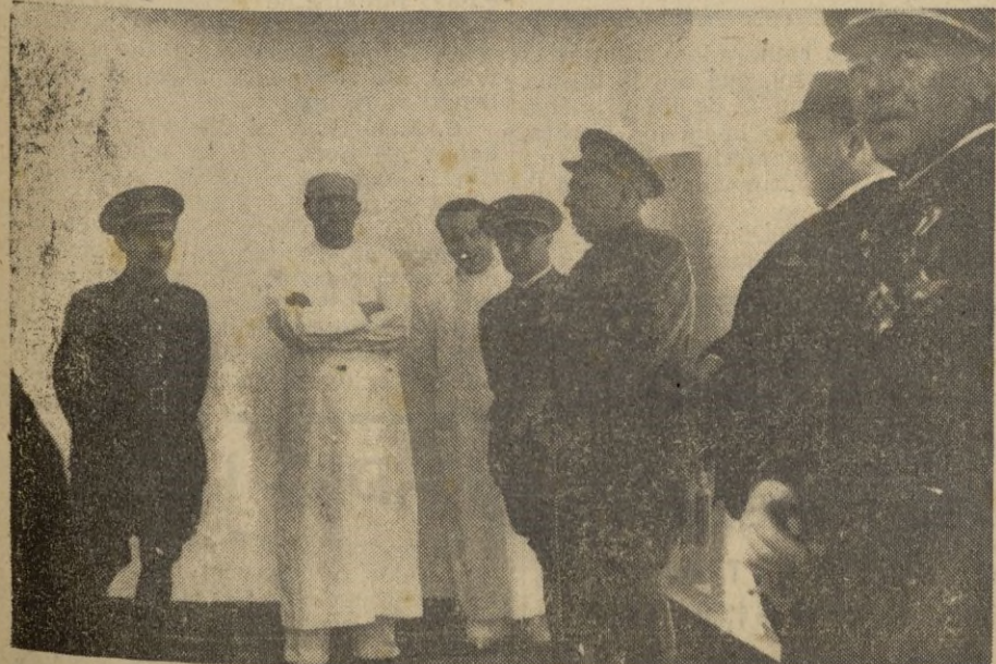
S. E. el Alto Comisario en la inauguración del nuevo Pabellón de Maternidad.

Alteza: Marca el 18 de julio para España una fecha gloriosa en su renacer espiritual que tuvo su origen en el 17 de julio, que ayer celebramos, fecha también gloriosa, en la que el Ejército inició la gloriosa gesta de nuestro Alzamiento, con el que tras lar