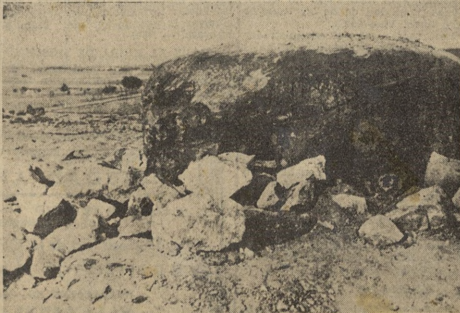
La cupula blindada de esta casamata, tomada al asalto por los alemanes, permite apreciar las dificultades que estos han vencido.