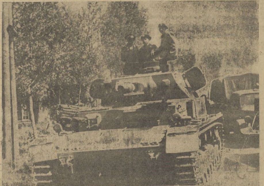
Grandes columnas blindadas alemanas avanzan por territorio ruso para hacer desaparecer la amenaza roja. He aquí el paso de un tanque pesado alemán por una carretera del Este.

La fuerza de penetración de las granadas alemanas resultó así más potente que la resistencia de las coras