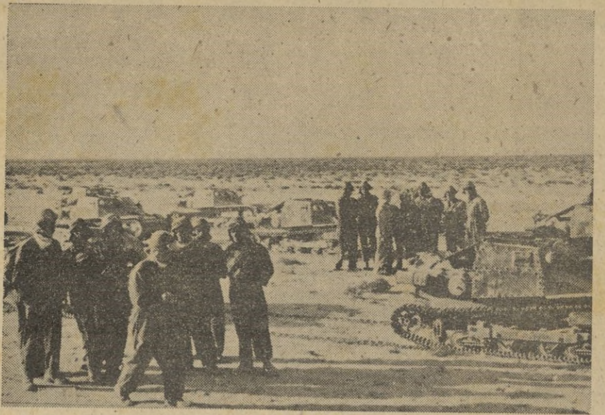
Fronte del Africa Septentrional.— Fuezas italianas avanzadas en Cirenaica, durante un descanso.

“Il Popolo di Roma”, pone de relieve que el propio mando británico ha calificado la batalla de Creta como la más violenta que hasta ahora se ha librado en la presente guerra. — EFE.