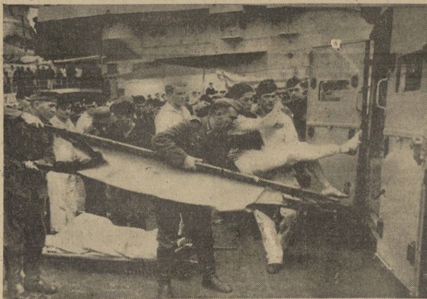
Llegada de un acorazado alemán a puerto. Los heridos procedentes de barcos mercantes ingleses hundidos son trasladados al hospital.