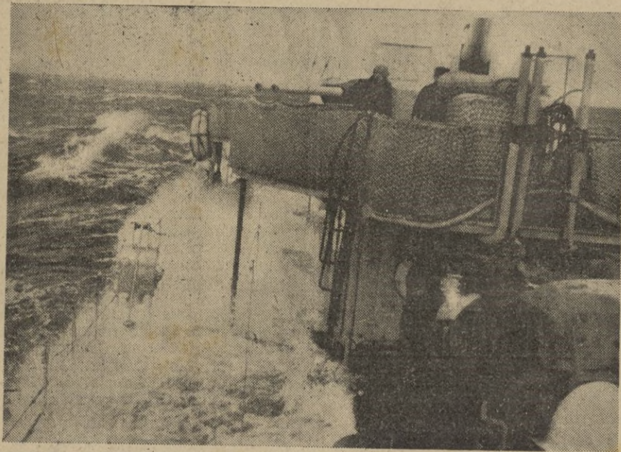
Torpedero italiano vuelve a su base después de haber atacado a un convoy protegido y hundido dos barcos de medio tonelaje, por un total de 16.000 toneladas.

El debate terminó sin votación y poco después la Cámara dió por terminada la sesión. — EFE.