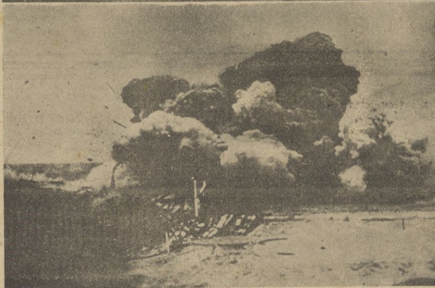
1. Paso de un grupo de paracaidistas alemanes por un puente que voló poco después por estar minado con una carga explosiva de reloj. 2. Momento de la voladura del puente, por el que poco antes pasaron los paracaidistas. El corresponsal que hizo la foto encontró la muerte en la voladura.