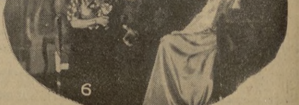
1, 3 y 6, varias escenas de "Madre Guapa", representada anoche en el Cervantes. 2, La Orquesta Planas, que también tomó parte en la función benéfica organizada por EL FARO. 4, un aspecto de la sala. 5, las bellas señoritas que amablemente se prestaron para acomodar al público.