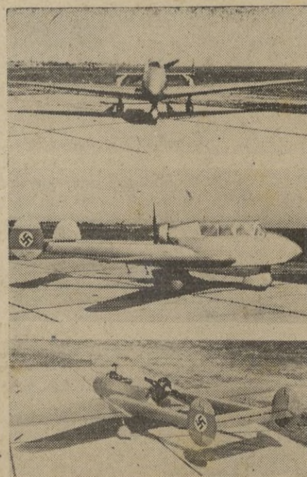
Una fábrica de aviones vienesa presenta este aparato de ensayo "Wn 16" cuya novedad consiste en el tren de aterrizaje compuesto de tres ruedas.