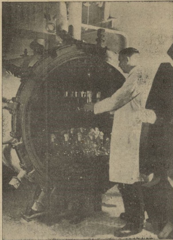
Uno de los aparatos de los laboratorios Behring

Entre todos estos faustos conquistadores, destácase de un modo verdaderamente excepcional y absolutamente merecido, Emil V. Behring, el modesto alemán — de los tantos que dieron la grandeza a su patria — hijo de un sencillo maestro de Hansdorf, de Deutsch-Eylau, que iniciando, sus estudios eclesiásticos una vez acabado el bachillerato, el destino le hizo conocer a un médico que le proporcionó una plaza en la "Pepiniere" — Academia Militar de Medicina — donde cursó nuevos estudios llegando rápidamente a oficial mé-