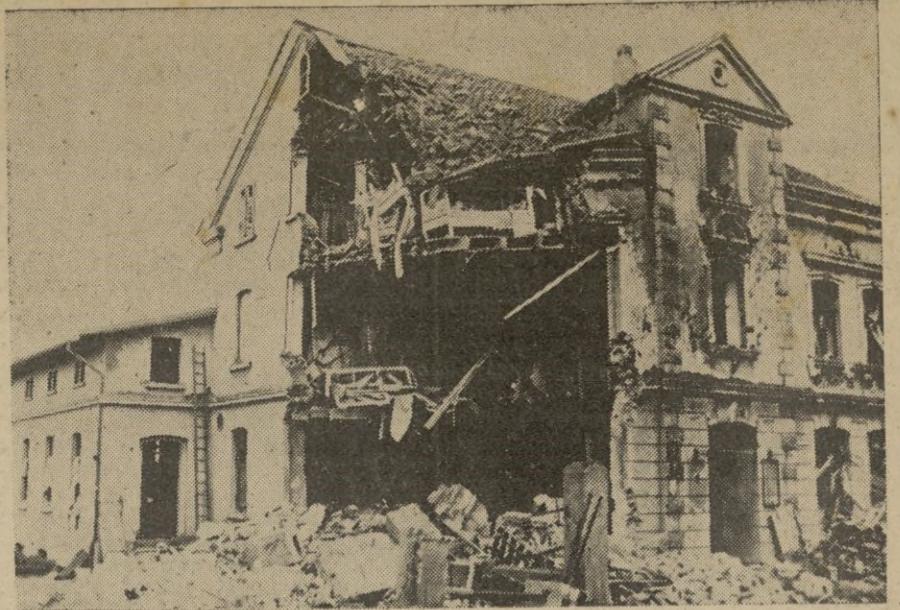
Destrozos causados por la aviación inglesa en una pequeña ciudad del Oeste de Alemania.

Cada alemán comprende que se juega en esta guerra su vida futura. — EFE.