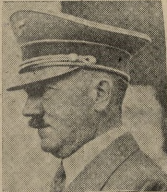
manas: el derrumbamiento del frente anglo-francés. Si en 1918 hubiera Alemania conseguido sólo una parte de este éxito, también habríamos ga-

Ocho semanas más tarde comenzó. Tal vez ya antes se había decidido la cuestión más importante de esta guerra. El 9 de abril, hicimos fracasar el peligroso intento de Inglaterra de asestarnos desde el Norte un golpe al corazón. Podía, pues, comenzar la lucha en el Oeste. La lucha tomó el curso establecido con anterioridad. Lo que no se consiguió en cuatro años de indecibles sacrificios durante la guerra mundial se terminó en pocas se-