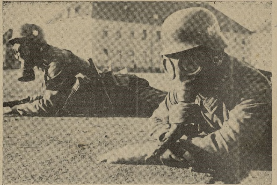
Las tropas de reserva alemanas reciben una instrucción muy rigurosa. He aquí un aspecto de ejercicios antiguos.

AÑO VIII. Ceuta, Martes 18 de Marzo de 1941 Núm. 1993