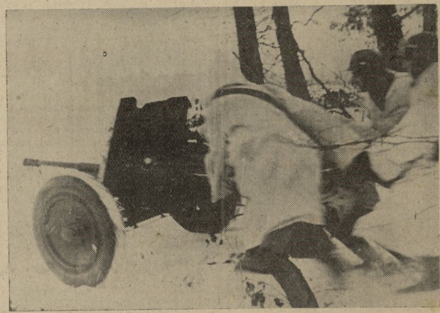
El Ejército alemán se prepara en ritmo intensivo. Estos soldados de un antitanque, bajo un manto de espesa nieve, acechan al enemigo en la maniobra militar. Es la preparación continua para poder superarse en acciones futuras.