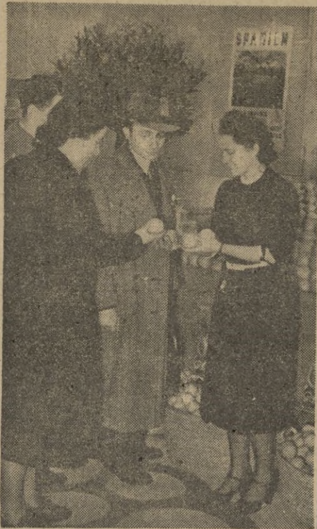
Detalle de la instalación española (frutas).

Entre estas naciones — sin faltar ni una sola de la Europa continental — se han destacado las instalacio-