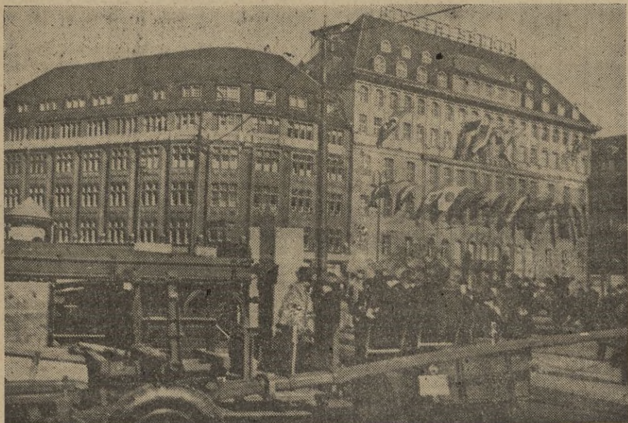
El edificio principal de la feria con las banderas de las naciones asistentes

nes de Italia — ocupando ella sola 20 grandes salas — Japón, el Iran, Bulgaria, Rumania, Hungría, Yugoslavia, Eslovaquia, Suiza, Bélgica, Holanda, Dinamarca, Suecia, Noruega, Finlandia, Turquía, Rusia, y España con sus aceites, vinos, frutas, e industria corchea, cuya instalación ha despertado gran interés.