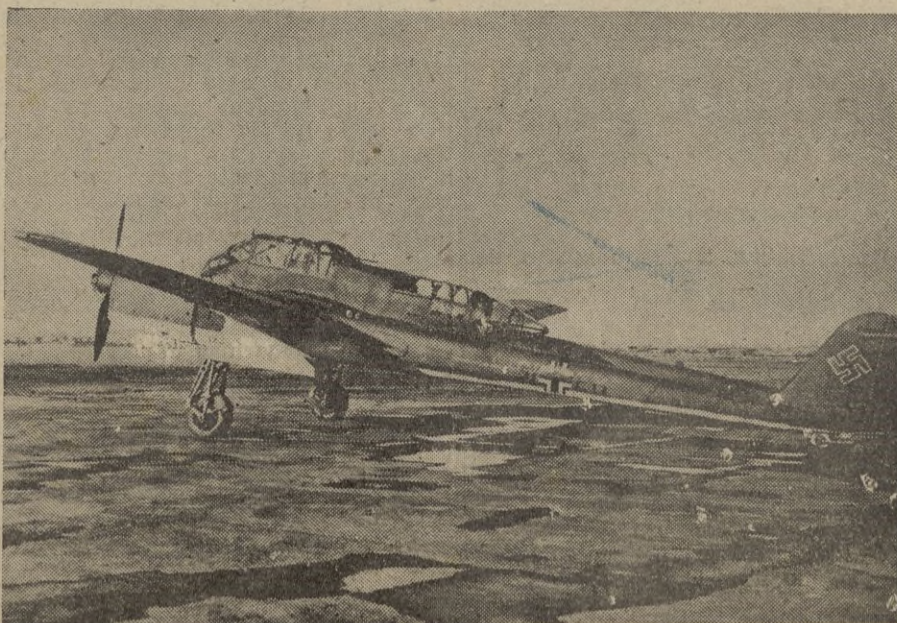
Ultimo modelo de avión de reconocimiento alemán tipo Focke-Wulf Fw 189 con doble fuselaje.

En Berlín se estima que el discurso constituye una elocuente prueba de que la política exterior de España, tiene, ante todo, a defender los intereses nacionales y seguir una línea clara de amistad hacia los países del Eje. — EFE.