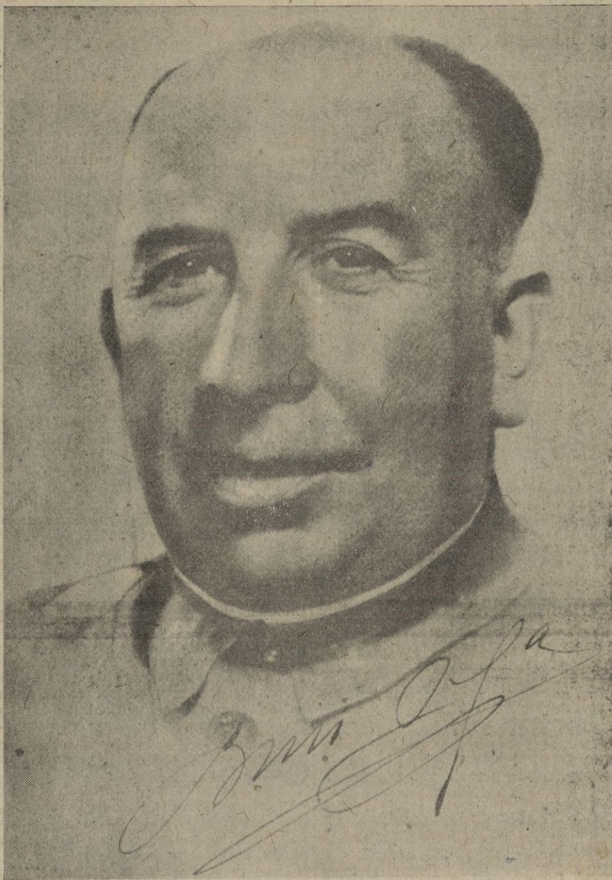
El nuevo Alto Comisario de España en Marruecos y General Jefe de su Ejército.

Otros veinte navíos se encuentran dispuestos para partir con el mismo destino. — EFE.