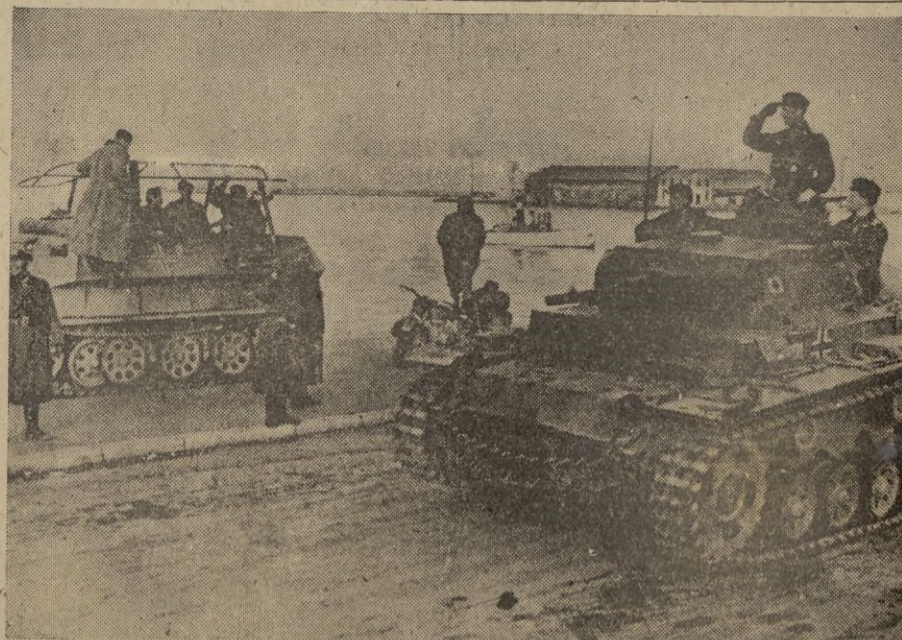
Tanques pasando revista.