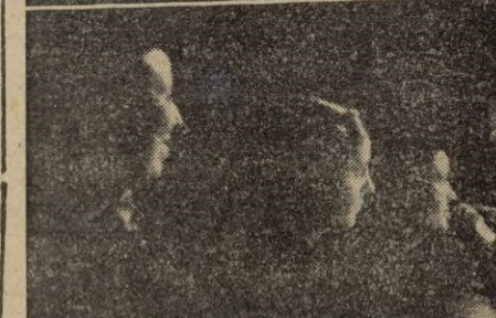
1. La Delegada Nacional. -- 2. Recordando las dependencias del Hogar de Falange. -- 3. Las camaradas de Puericultura, prestan juramento. -- 4. La Delegada Nacional entre sus camaradas. -- 5. A la entrada del Teatro Cervantes. -- 6. En un palco con las delegadas de Tetuán y Ceuta. -- (Fotos Cabrera-Guadarrama.)