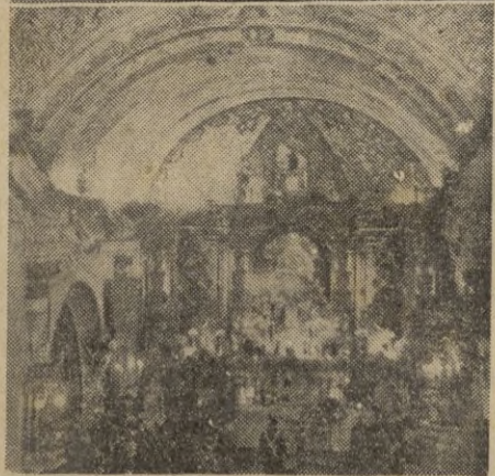
1. Monumental embema del Arma levantado a la entrada del Santuario de Nuestra Señora de Africa. — 2. Momento de la misa en honor del Santo.