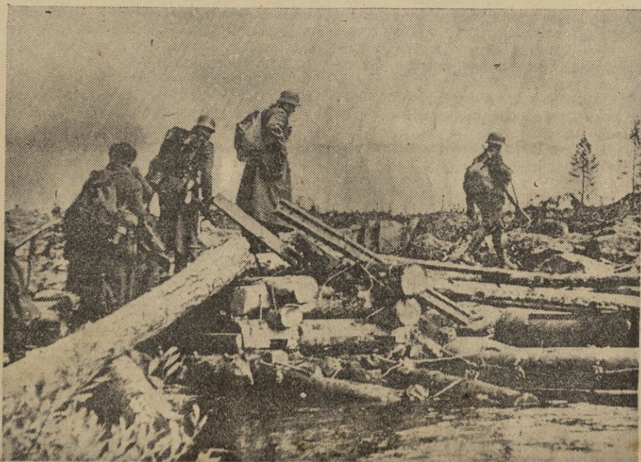
Después del bombardeo metódico de las fortificaciones rusas por la artillería pesada, los zapadores alemanes de choque construyeron rápidamente un puente provisional por el cual la compañía de infantería pudo penetrar fácilmente en las fortificaciones.

gurado entre los puertos de Europa y de Africa. — EFE.