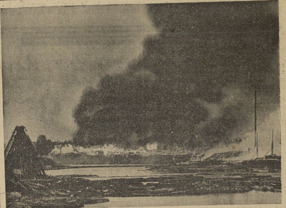
Un terrible incendio que devastó casi por completo el barrio de una ciudad rusa en el frente del Norte.