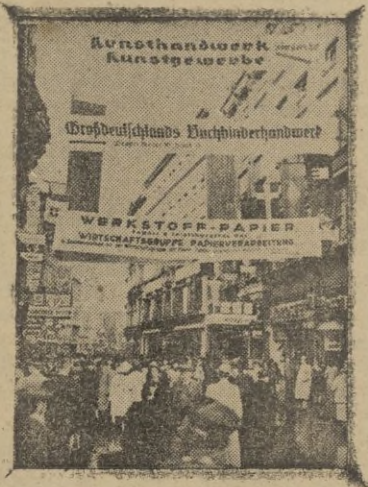
Una de las calles de Leipzig, durante la feria.

El hecho de tales momentos bélicos es cierto, pero también lo es, con una realidad verdaderamente extraordinaria, la celebración ininterrumpida de esta y otras exposiciones, que la gran Alemania sabe hacer compatibles con sus actividades guerreras. El pueblo alemán continúa la guerra, cada vez más victoriosa, y a su vez, sigue su gran labor constructiva y es-