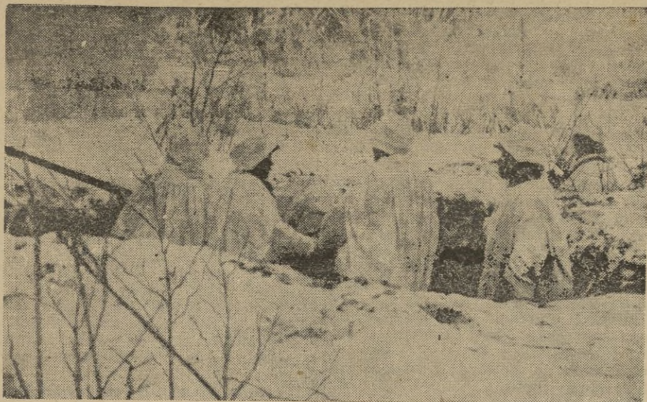
¡A 20 bajo cero!

Todo el material de aviación empleado por las Indias Neerlandesas ha sido americano. Uno de los primeros contratos de esta clase, fué el de la Glenn L. Martin Co. Baltimore en 1915 desde entonces, vienen siendo los aviones Martin los preferidos del Cuerpo de Aviación de las Indias. Hoy en día figuran también muchas otras casas constructoras americanas en el suministro de material aéreo, tales como Lockheeds, Surtiques, Brewsters y Ryans". -- D. T.