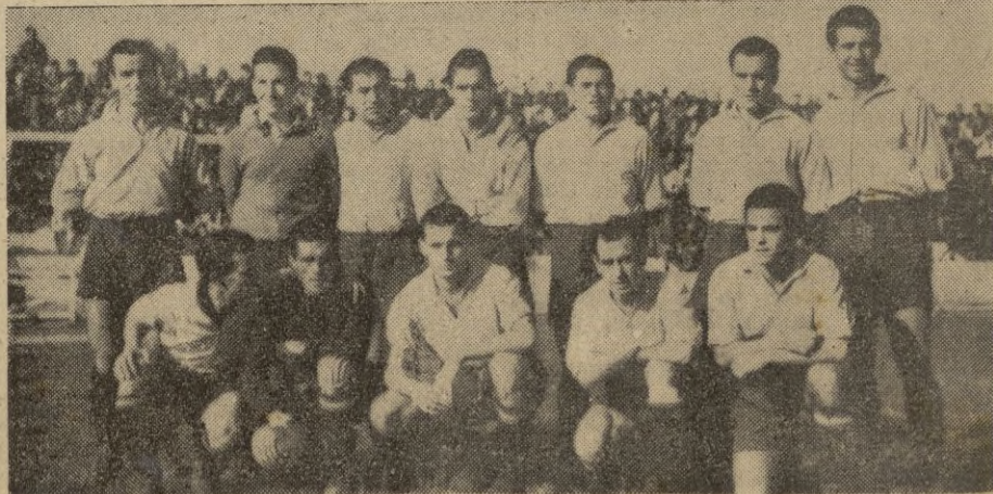
Vencedores y vencidos, tal como se alinearon el pasado domingo.