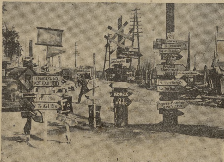
Este jeroglífico de indicadores de direcciones nos habla de la complejidad del frente ruso.

También hay unos doce buques mercantes británicos anclados en la bahía, según parece, para un convoy. — FIERRO.