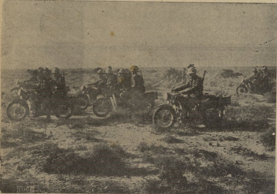
AFRICA SEPTENTRIONAL. - Columna motorizada italiana rebasando las primeras líneas.

Al Oeste de la línea Stalin todavía quedaba hasta el límite de Alemania una distancia equivalente que el dictador rojo había preparado como vanguardia fortificada instalado punto a punto a las líneas germanas una larga serie de aerodromos en donde existían millares de aparatos que fueron fácilmente destruidos en los primeros días del asalto. La pericia y la energía de Hitler secundado por los Ejércitos de von Leeb, von Bock, y von Runstedt, estos últimos apoyados por el general Antonescu, dió al traste con los formidables preparativos de los soviets. Luego a lo largo de la referida línea Stalin los bolcheviques tenían organizado la segunda línea defensiva cuyos puntos principales están señalados en el gráfico adjunto, a saber: Lago de Ilmen, Velikie Luki, Smolensko, Gomel, Kiev, Uman y Odesa. Vencidas las dificultades de la línea y de la antelínea la amenaza de los aliados se concreta ya en la próxima catástrofe de Moscú.