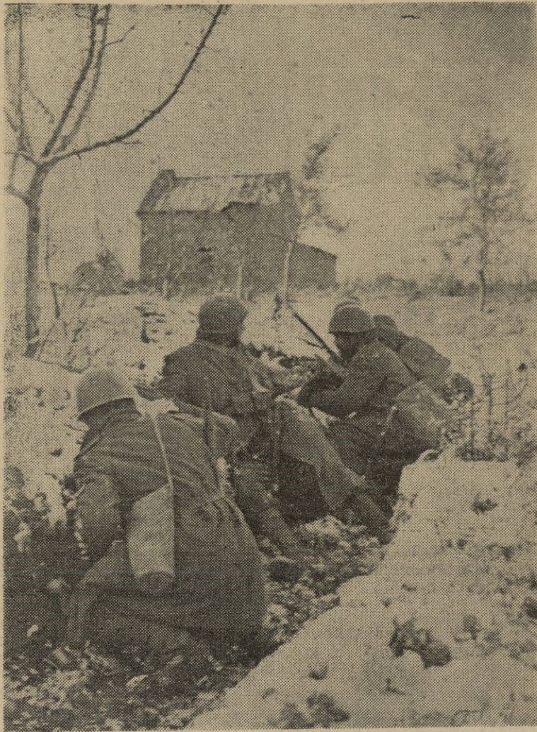
FRENTE RUSO. -- En una posición italiana avanzada preparándose para el ataque.

Washington, 28. — El embajador norteamericano en la URSS, Steinbrade, ha sido recibido por Corder Hull y por el Presidente Roosevelt. — EFE.