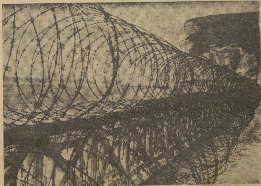
Toda la costa del Atlántico está protegida de tal forma, que cada intento eventual de un desembarco está con denado a fracasar. Allí, donde la costa es de fácil acceso, las tropas alemanas han colocado fuertes y eficaces obstáculos de alambre.

Younking, 4. -- Han llegado a China cantidades cuantiosas de material para hacer la guerra al Japón, entre el que se cuentan aviones, camiones, carros blindados, tanques, etcétera. -- EFE.