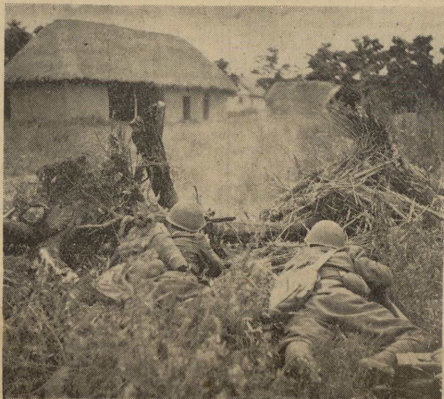
FRENTE RUSO: Tropas italianas luchando contra las últimas resistencias del enemigo

Berlín, 23. — Las fuerzas bolcheviques han intentado romper el frente establecido ante San Petersburgo, utilizando importantes blindados soviéticos; pero los colosos blindados soviéticos fueron sorprendidos por los carros alemanes que destruyeron a cañonazos cinco de los que iban a cabeza de la columna. Una de estos carros rusos entró en un campo de minas e hizo explosión. Los tanques alemanes en hábil manobra lograron empujar a los guerreros artefactos, hacia una zona que había sido minada por las tropas alemanas. Cerca de quince carros llegaron a un punto del que no podían pasar. La artillería alemana abrió el fuego sobre este sector. Varios de los carros fueron alcanzados por los proyectiles, mientras que otros realizaban sus últimos esfuerzos a fin de evitar la destrucción a que estaban amenazados; pero todos los intentos fracasaron y uno tras otro quedaron sobre el campo de batalla, sin que uno solo de ellos pudieran regresar a San Petersburgo. — EFE.