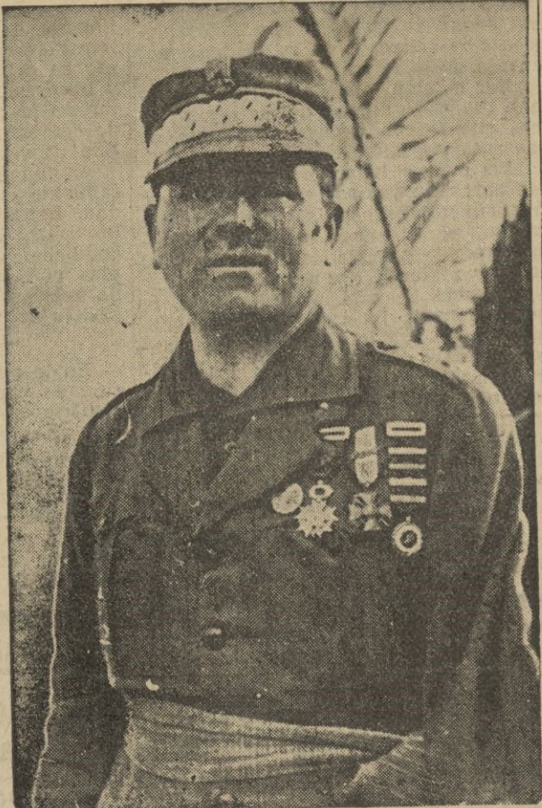
El Excmo. Sr. general don José Millán Astray, gloriosa y tradicional figura de los Mutilados de España.

Los que con su valor contribuyeron a la salvación de la Patria, tendrán hoy, día de su Patrón excelso, la reverencia de los españoles todos, que habremos de hacerle el saludo de España, en el brillante vibrar de los himnos nacionales.