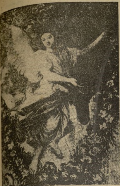
El arcángel San Rafael, Patrón del Benemérito Cuerpo de Caballeros Mutilados.