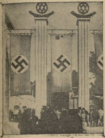
Uno de los paseos de la feria.

Alemania, sin abandonar la lucha, en la que sigue obteniendo triunfales e ininterrumpidas conquistas, continúa