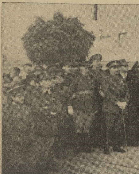
Ceuta.—Autoridades y jerarquías que presidieron estos actos.