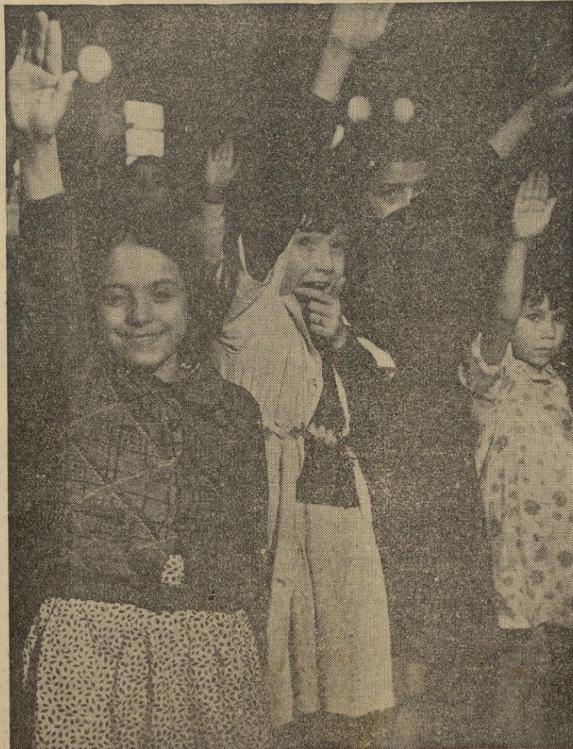
Y por último a la terminación de las comidas o cualquier acto que se desarrolle en los Centros las estrofas viriles y sublimes del "CARA AL SOL" y los gritos de "FRANCO" "FRANCO" "FRANCO", "ARRIBA ESPAÑA" atonan el espacio lanzados por cientos de voces infantiles y corazones plerícos de fe y de amor.

Comedores infantiles. — Promedio asistencia diario 400 Aportaciones y subvenciones a diversas instituciones benéficas de