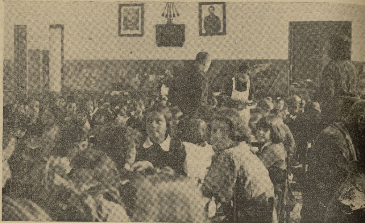
Uno de los comedores infantiles--barriada del Príncipe--de CEUTA

Ceuta y Melilla, Tetuán y las regiones occidental y oriental, del Rif y de Gomara, bien pronto crearon centros de auxilio o reformaron los existentes. Y en la española Ceuta, fidelísima Melilla, en la blanca Tettauem, brava Larache, en las montañas misteriosas de la silenciosa Chauen y en la incógnita tangerina —contra viento y marea — la camisa azul, la sonrisa en los labios y constante tensión, irrumpieron en locales y centros llevando nuestras camaradas la alegría y fraternidad, sello característico de la obra.