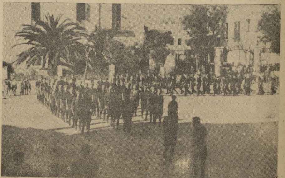
Ceuta.—Un detalle del desfile.

La emisora de F. E. T. número II, local, dedicó una emisión especial a la conmemoración de tan glorioso aniversario que resultó interesantísima.