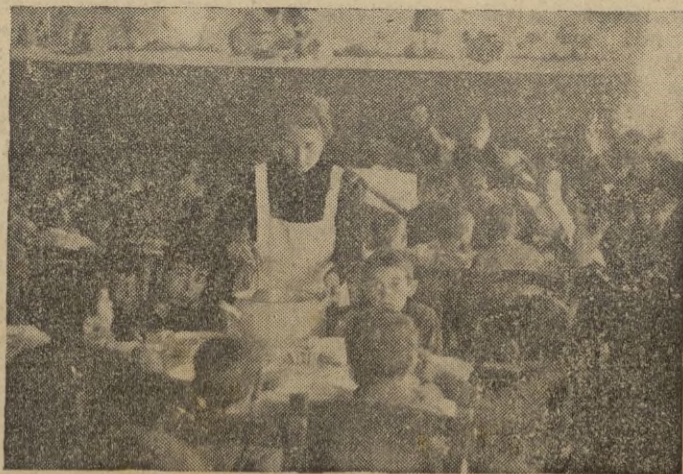
Un rincón de los comedores infantiles de TETUAN

Y el padre, ante la duda materna, ante los hechos palpables, destrozado moralmente, tímido y receloso, a través de los amplios ventanales de la obra —entre visillos y flores— abiertos y llenos de amor procuró enterarse de lo que Falange era, de lo que Auxilio Social significaba. Y los comedores, alegres y risueños primero y más tarde los centros puericultores, hogares y guarderías, iban modelando el alma de los