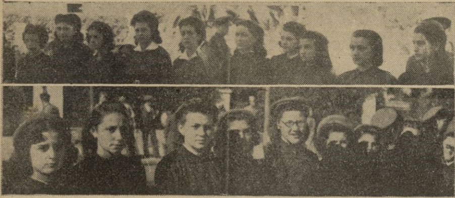
Ceuta.—Flechas que pasaron a la Sección Femenina.