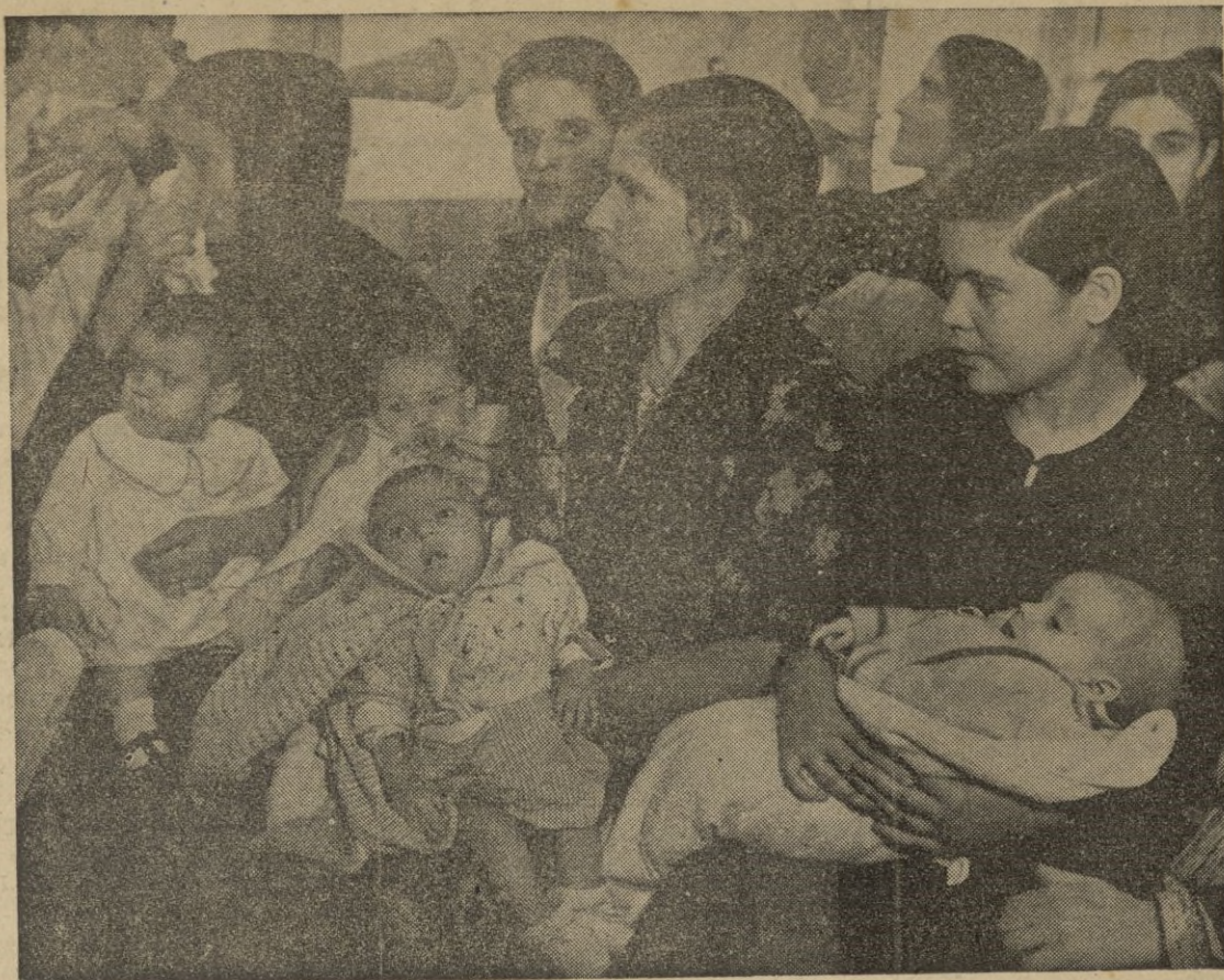
En los Centros de Alimentación Infantil -- TETUAN -- las madres pasan periódicamente consulta llevando a sus hijos, cuya vida se atiende y vigila.

jar cifras que sumadas deslumbren con datos estadísticos.