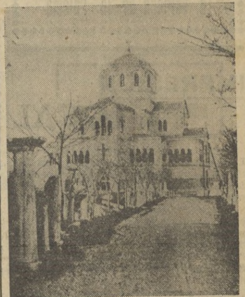
Una vista parcial del lugar que ha vuelto a ser bombardeado.

ción en unión del ejército, la D. C. A. y aviones de reconocimiento, han destruido en la campaña rusa desde el día 22 de julio al 27 de agosto, un total de 1.108 aviones soviéticos. De dicha cifra la D. C. A. ha derribado