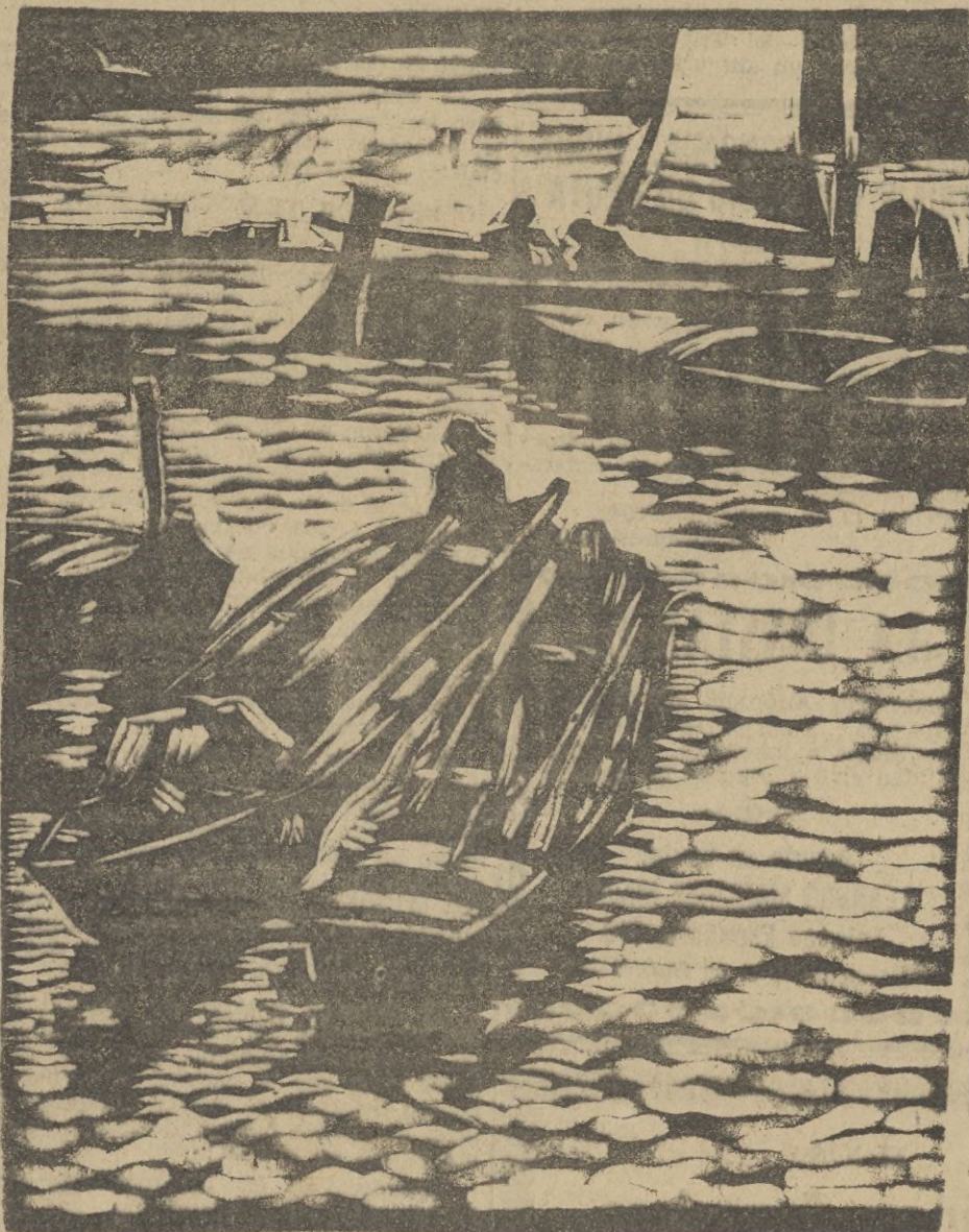
Uno de los trabajos de linogrado, que figura en la exposición.

Los tipos árabes que Soós-Caragea expone tienen un carácter especialísimo. No son retratos como otros tantos. Son la impresión que el artista ha recibido en su retina al ver el original, y los rasgos duros o dulces que su concepción le ha hecho llevar a la