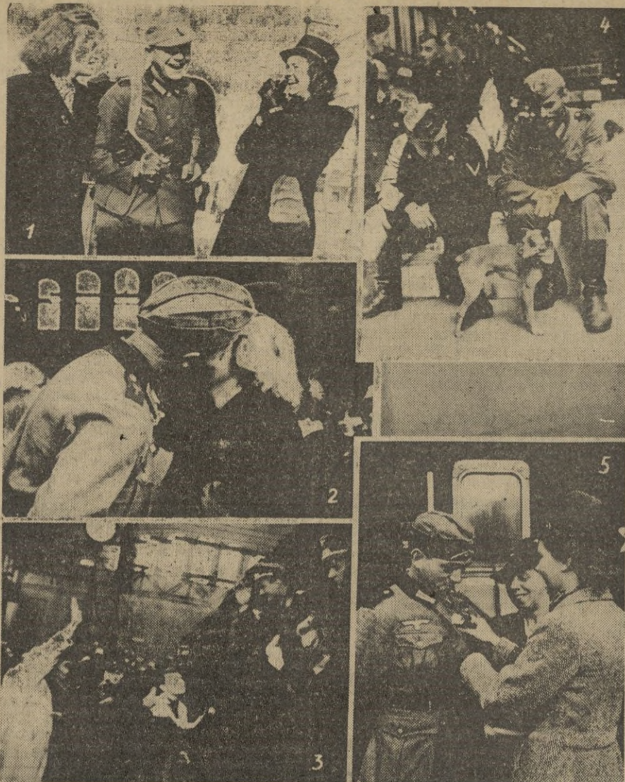
DESPUES DE LARGAS HORAS DE COMBATE, SOLDADOS ALEMANES QUE VIENEN DE PERMISO LLEGAN A LA ESTACION DE ANHALTER, EN BERLIN