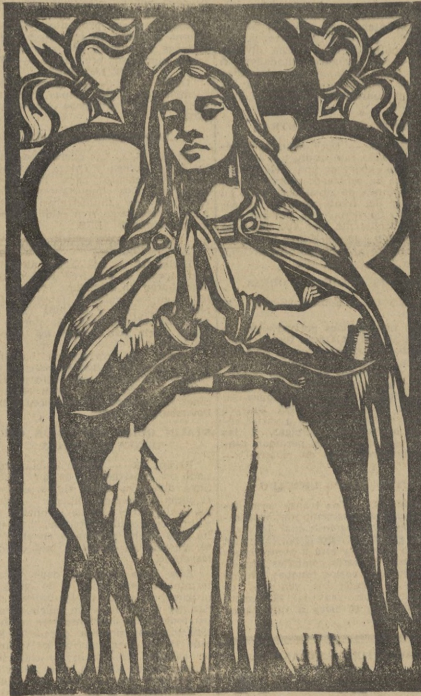
Uno de los trabajos de linograbado que figuran en la exposición del marqués de Soós Caragea. La milagrosa Virgen Patrona de Rumania.

De todas maneras con o sin público, el valor de las obras expuestas es el mismo que en los días que quedan, nuestro público, que tantas veces se ha mostrado interesado en cuanto a Arte se refiere, sienta un poco de curiosidad, y otro poco de deseos de rectificar su opinión, y suba las escaleras del Vicentino.