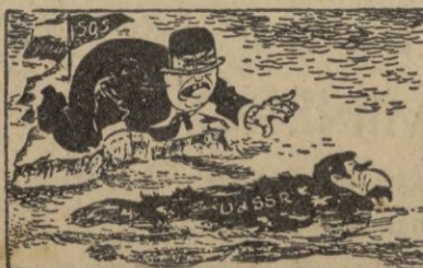
Churchill. — Maldita sea, se me llevan hasta esta piel de oso. (De "Die Gruere Post" de Berlín).

unidades que son visibles desde la costa finlandesa. — EFE.