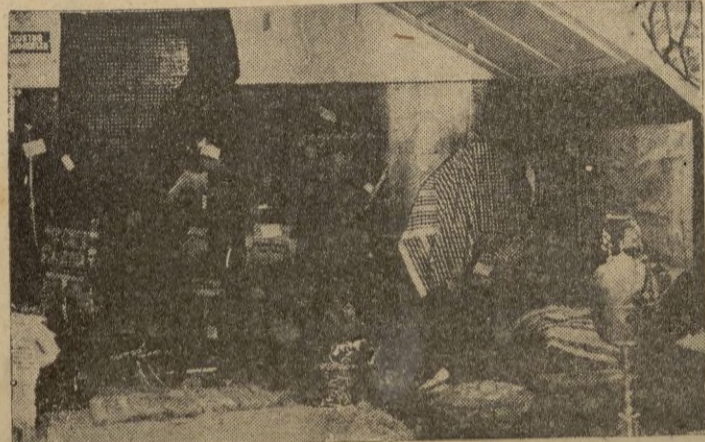
Algunos trabajos de arte típicamente marroquí.

ACADEMIA CCC • Centenario. 6 • SAN SEBASTIAN