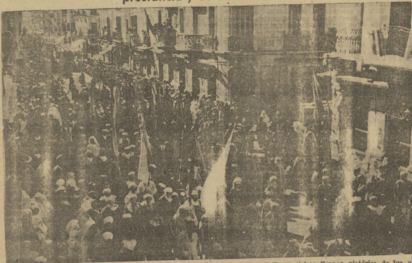
Como maravillosa visión los Gremios musulmanes desfilan por la calle del Generalísimo Franco, plétórica de luz, alegría, fe y entusiasmo.

En el marco maravilloso de la Plaza de España y ante una concurrencia de varios miles de personas se celebró el acto lleno de majestuosa prestancia y de cálido fervor