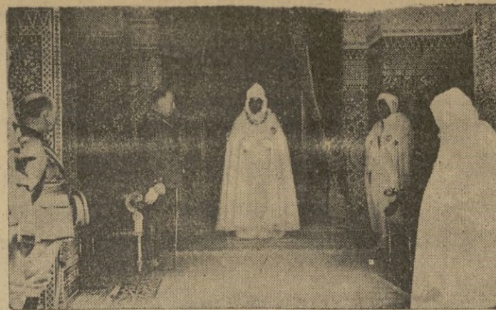
De la visita de S. E. el Teniente General Orgaz al Mexuar. -- S. A. I. el Jalifa lee su discurso, contestación al pronunciado por el Alto Comisario.

Vuestra intervención en cuanto acontece en este territorio no se reduce a una mera contemplación, desprovista de interés por su bien-