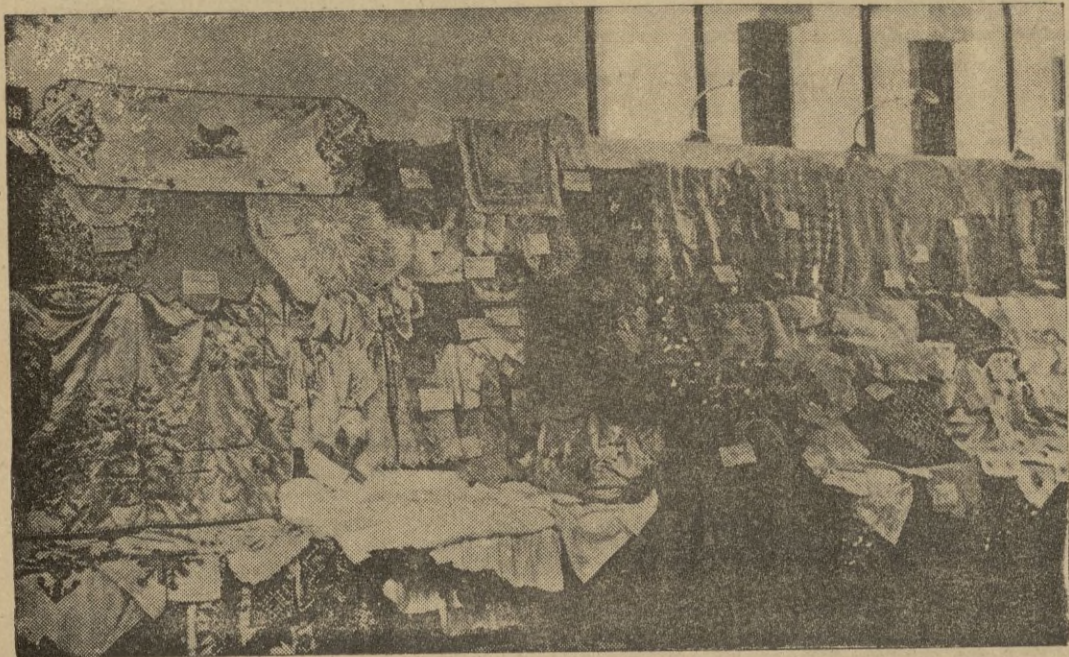
Trabajos femeninos, maravillosos, presentados al concurso.

Como se sabe en los bajos de la Audiencia se halla instalada la exposición de trabajos presentados por los distintos expositores españoles y marroquíes en el cuarto concurso de artesanía hispano-marroquí.