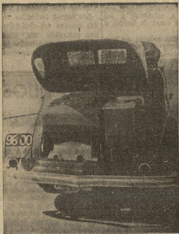
Coche Hotchkiss 17 H P. con instalación de gasógeno Auto-Hall Hotchkiss, con un recorrido de 20.000 kilómetros sin interrupción.

veinte por ciento de economía como mínimo por cada cien kilómetros. Y también mayores beneficios para el Estado, puesto que, al aumentar el número de viajes, los impuestos de toda índole se elevaban a mayor suma.