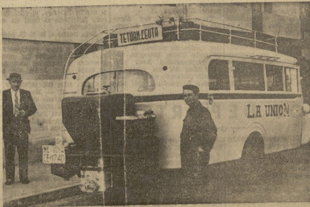
Autobús Chevrolet, propiedad de la Empresa "La Unión" de servicio Ceuta - Tetuán.

la necesidad de restringir los carburantes, y haciéndonos eco de las disposiciones del Estado sobre los gasógenos, nos decidimos a hacer los primeros ensayos en los coches de la empresa La Bilbaina. Al efecto acoplamos gasógenos a dos coches de línea, que realizan el servicio entre Ceuta y Tetuán. Y observamos que se obtenía un