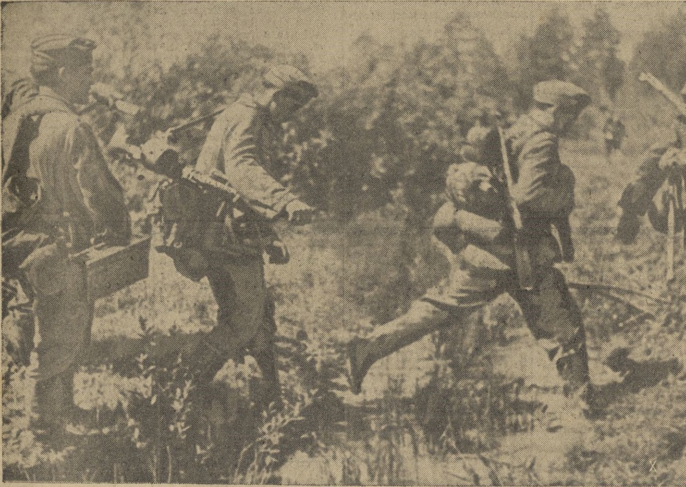
Infantería alemana se abre camino a través del terreno pantanoso del sector de Rjev para repeler un ataque de los soviets.