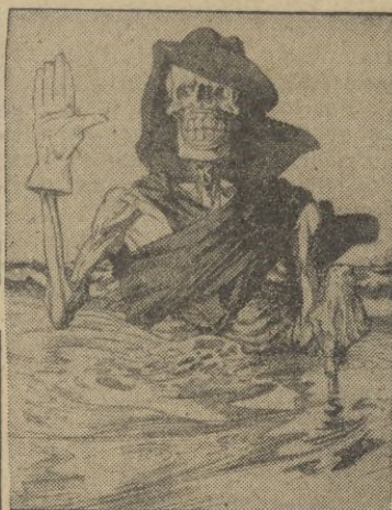
El encargado de la circulación en el Atlántico: “¡Travesía libre... por vuestra cuenta y riesgo!”

Esta es la razón fundamental — termina la información — de que nuestros adversarios tengan tantas vacilaciones en la creación del segundo frente. — EFE.