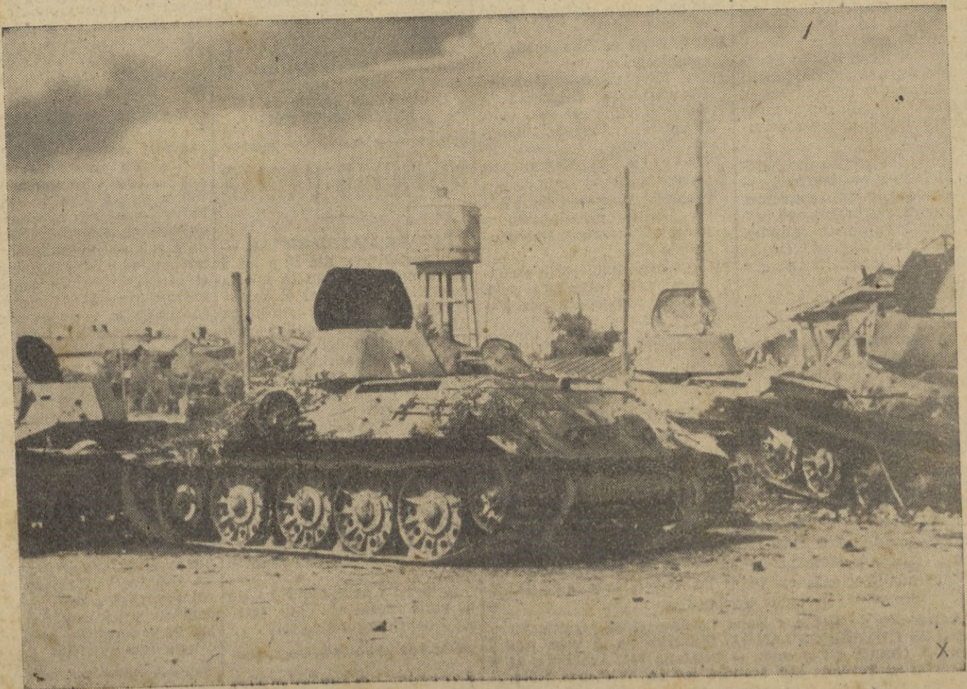
Los caminos de la retirada soviética están sembrados de pertrechos de guerra destruidos por las armas anti-comunistas

Roma, 12. 2 m. — El general Ettore, comandante jefe de las fuerzas italianas en el Africa del Norte que acaba de ser promovido al grado de mariscal, nació en Bolonia en 1876 y tomó parte en las guerras de Trípoli, Europa y civil española. Es Senador desde marzo de 1939, posee la Cruz de Hierro de Primera clase y la más alta condecoración ita-