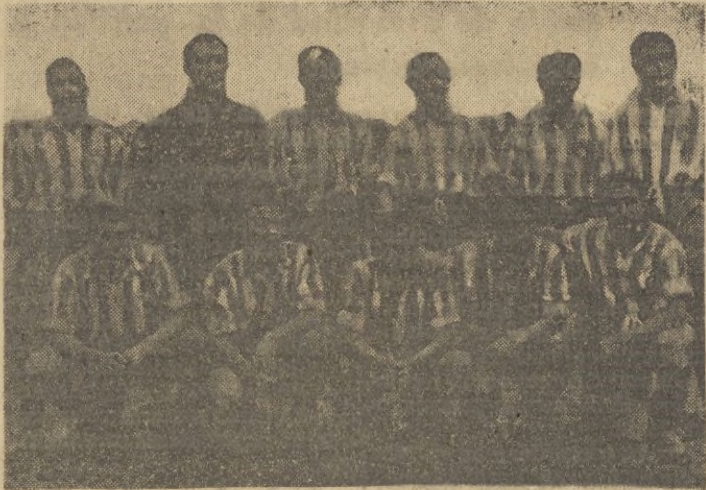
El R. C. D. Español de Barcelona, que esta tarde se enfrentará al Ceuta en el Estadio.