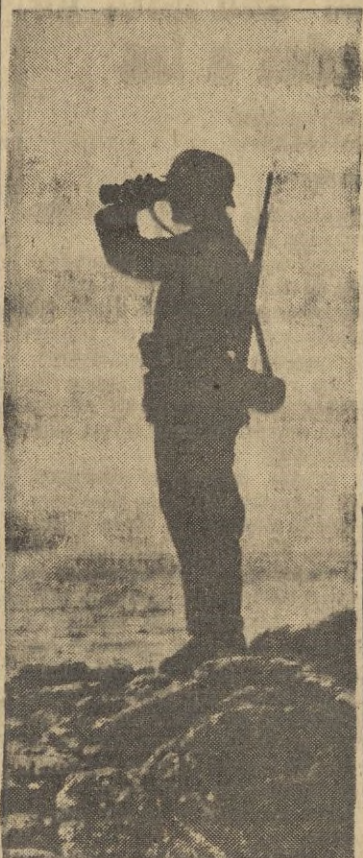
Atardecía y el centinela alemán, firme en su puesto observaba el revuelto Canal de la Mancha.

comisión del Senado de los Estados Unidos, quien según anuncia la United Press aún el veinte de agosto manifestaba su esperanza de que el ataque de desembarco conjunto se ex-